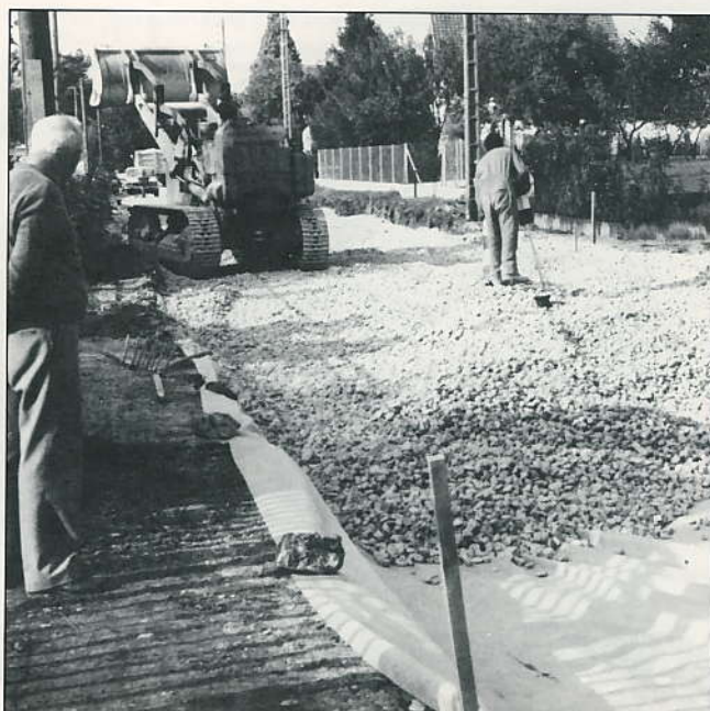
Une vue des travaux de la rue des Chanois.