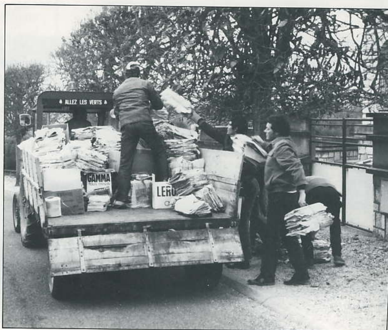
Les conseillers municipaux participant au ramassage du papier.

Quant au ramassage du verre, depuis le 1 er octobre que le conteneur est en place, c'est près de 5 tonnes qui ont été récupérées au profit de la Ligue contre le cancer. Bravo, continuez !