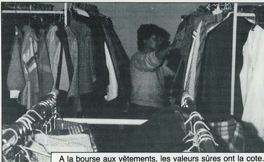
A la bourse aux vêtements, les valeurs sûres ont la cote.

La messe de la nuit de Noël sera célébrée en l'église de Livry le lundi 24 décembre à 21 h 30 par M. l'aumônier de l'hôpital de Fontainebleau.