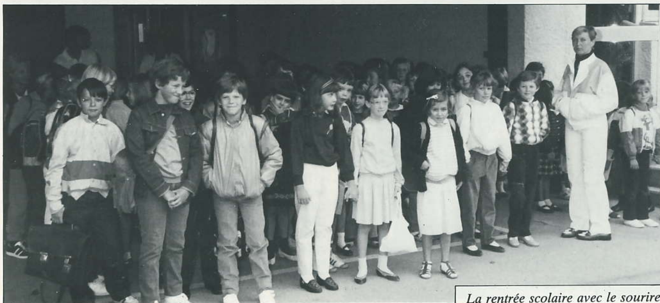
La rentrée scolaire avec le sourire.