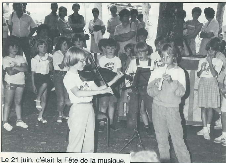
Le 21 juin, c'était la Fête de la musique.

L'assemblée générale de l'A.R.P.A.C. se tiendra le vendredi 19 octobre à 18 h au Foyer-Résidence. Pensez au renouvellement de votre carte des Amis de la Chesnaie.