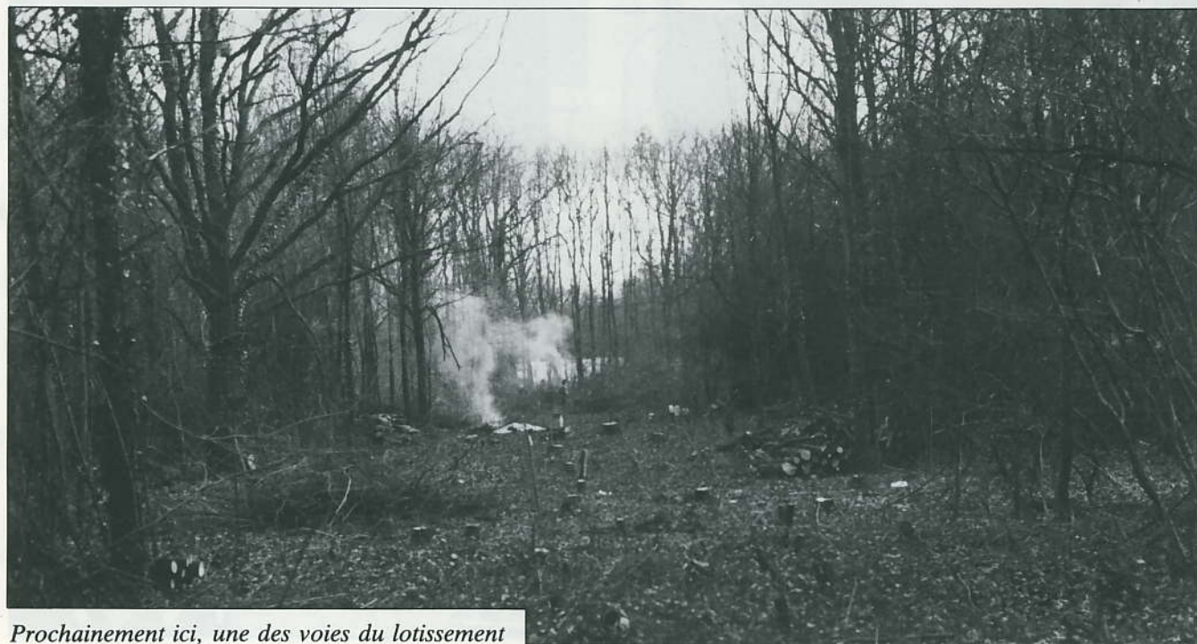
Prochainement ici, une des voies du lotissement

Le prochain ramassage des objets encombrants aura lieu le lundi 23 mars.