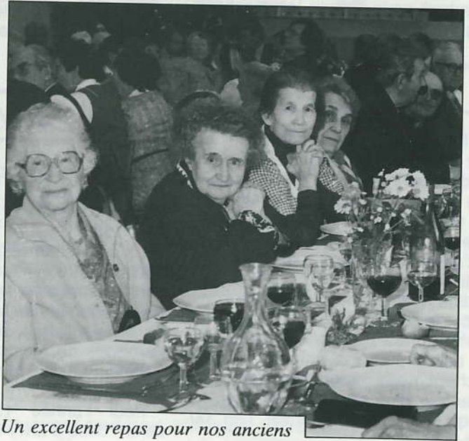
Un excellent repas pour nos anciens

Prenez contact avec l'A.S.S.A.D.-R.M., 15 rue Paul-Valéry à Melun, 64.38.47.17 (tarifs : 70 F de l'heure, déplacement compris).