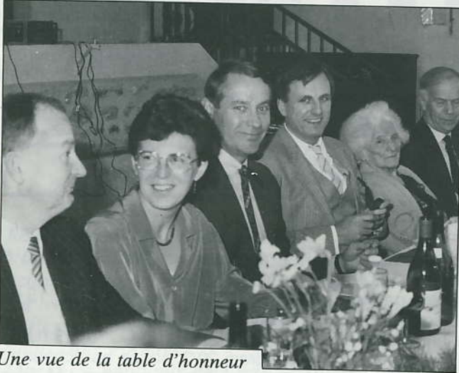
Une vue de la table d'honneur