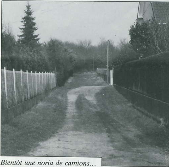
Bientôt une noria de camions...