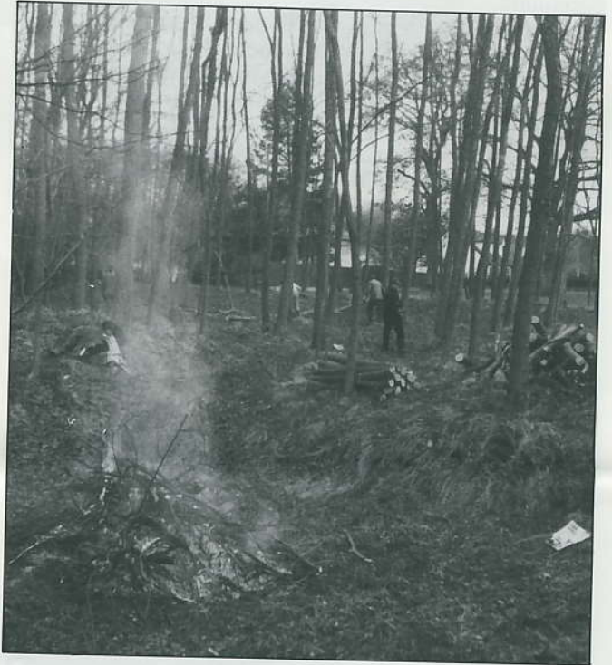
▼ La grande toilette du parc Armand-Vivot ▲