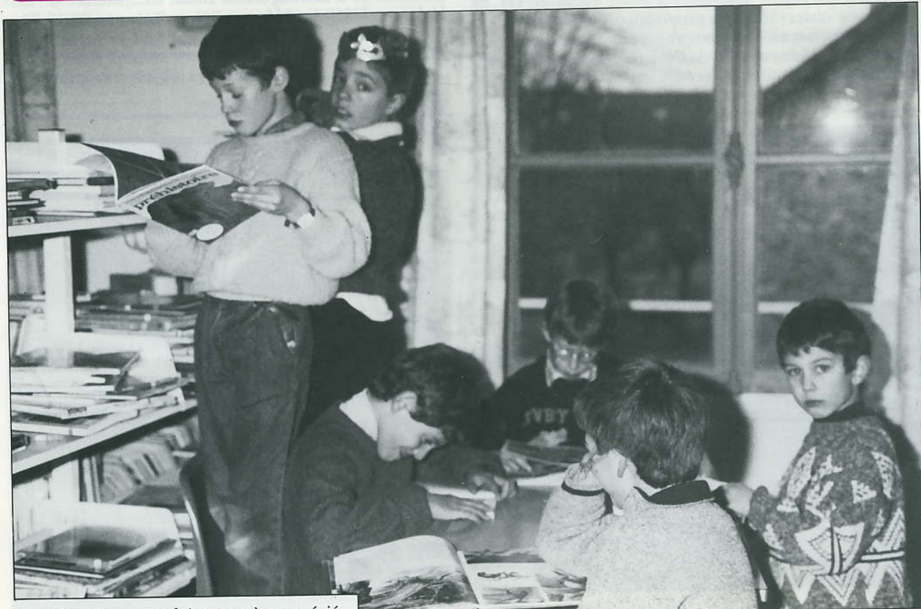
La bibliothèque scolaire est très appréciée

Le conciliateur, dont les interventions sont entièrement gratuites, tient une permanence en mairie de Melun les 2 e et 4 e mardis de chaque mois, à partir de 15 heures.