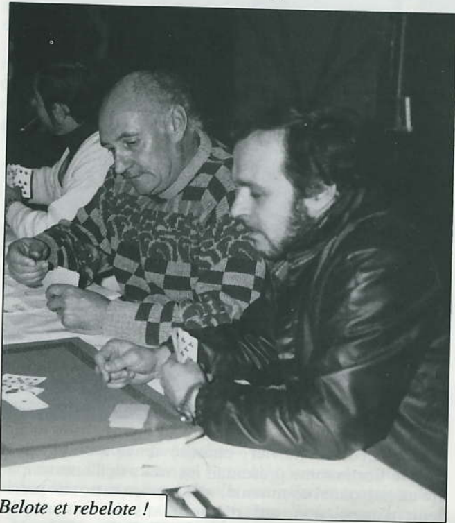
Belote et rebelote !

Depuis octobre et le dernier Livry-Info , le Comité d'Animation a tenu son assemblée générale le samedi 13 décembre au Foyer-Résidence. Les différents intervenants ont rappelé l'ambition de l'association, à savoir réunir les habitants et faire participer un maximum de personnes à l'animation du village.