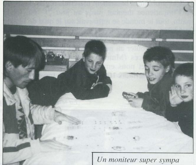
Un moniteur super sympa

Le centre d'accueil de La Motte-Chalancon, ouvert depuis 1987, essaie d'attirer un maximum de groupes scolaires en proposant des activités originales et intéressantes, mettant à la disposition des enfants des locaux accueillants, du personnel d'encadrement dynamique et des professeurs qualifiés disposant d'un matériel complet et varié. Pour ce qui concerne l'astronomie : télescope, planétarium, lunette astronomique, etc. (Au fait, quelle est la différence entre un télescope et une lunette ? l'objectif d'une lunette est constitué de lentilles, celui d'un télescope d'un miroir.)