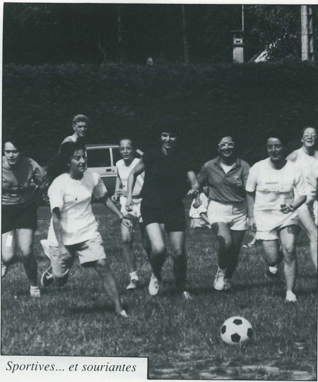
Sportives... et souriantes