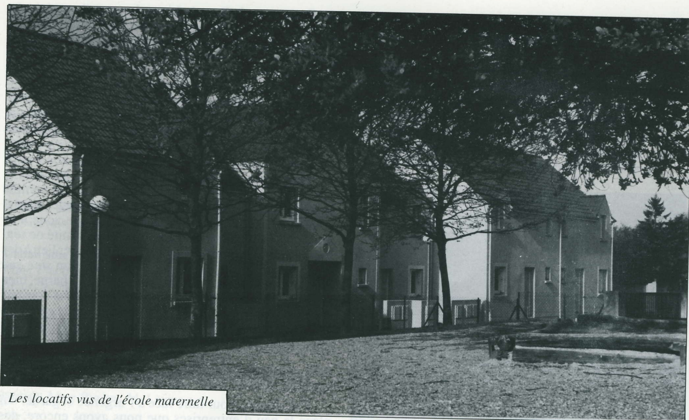
Les locatifs vus de l'école maternelle

L'aménagement de la Villa du Nil, devrait nous aider à trouver les solutions aux problèmes qui se poseront avec de plus en plus d'acuité dans les années qui viennent : circulation, stationnement, commerce, animation.