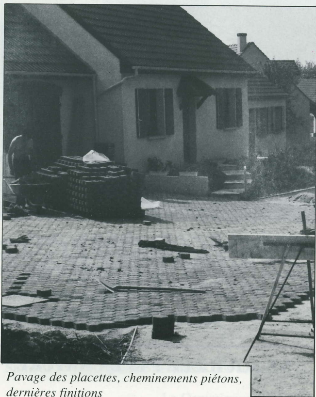
Pavage des placettes, cheminements piétons, dernières finitions

Enfin ! La réception des travaux du lotissement des Dragées a eu lieu le mercredi 31 mai. Voiries, bordures, clôtures, éclairage, plantations, finitions diverses, tout y est. Reste, pour parachever le tout, à réaliser la seconde partie de l'avenue du Bois-de-Givry, qui permettra de monter de la rue du Four-à-Chaux jusqu'aux Dragées.