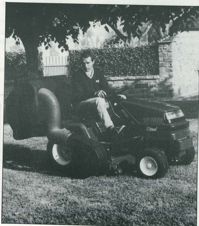
Le matériel communal se modernise et gagne en rapidité et en efficacité

Vous vous intéressez à la vie de votre commune, vous êtes soucieux de son développement, de son avenir: Participez aux commissions extramunicipales !