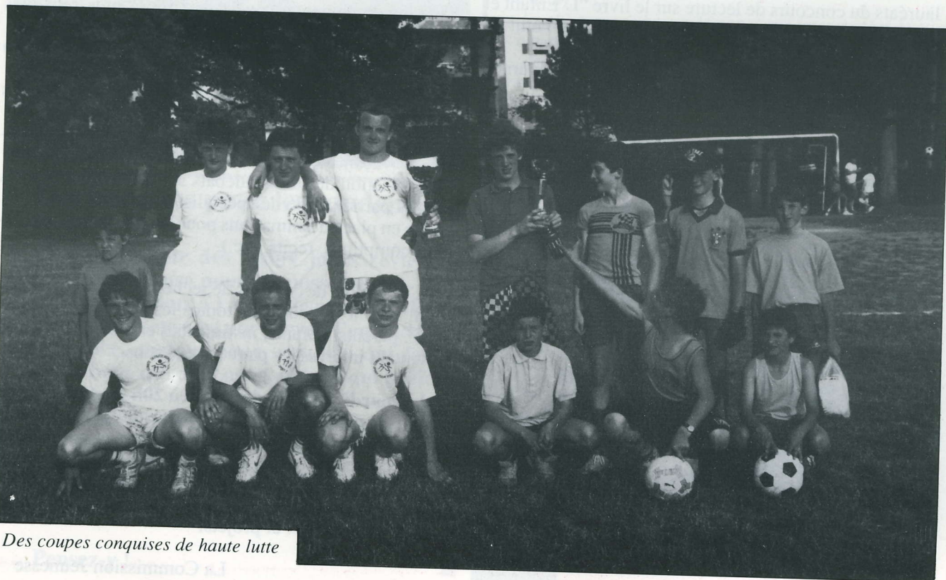
Des coupes conquises de haute lutte

Outre le 14 juillet, la prochaine grande manifestation est attendue pour le 17 septembre : ce sera le bric-à-brac