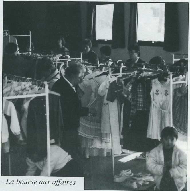
La bourse aux affaires

Frais d'emplacement : vélos 10 F; mobylettes 20 F; motos 30 F. Inscriptions sur place.