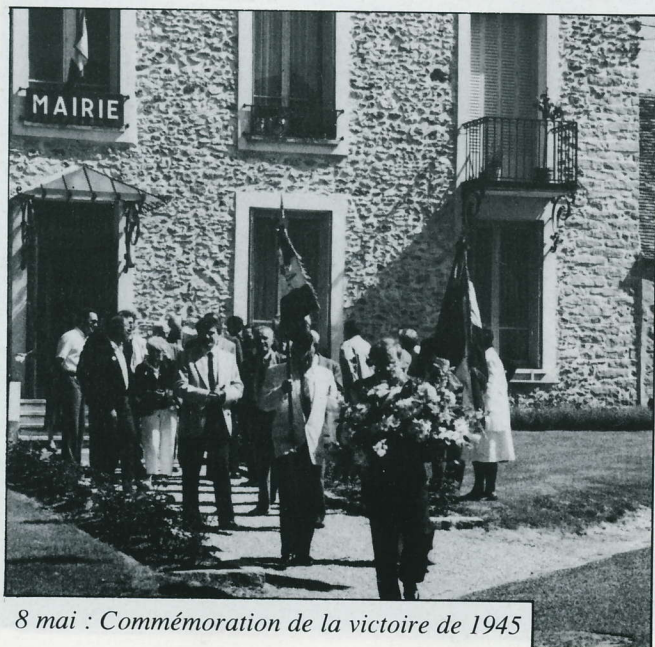
8 mai : Commémoration de la victoire de 1945

Cette classe prendra part à un voyage d'une journée à destination de la Sologne.