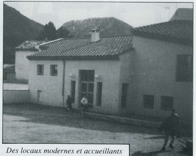
Des locaux modernes et accueillants

Le centre d'accueil de La Motte-Chalancon, ouvert depuis 1987, essaie d'attirer un maximum de groupes scolaires en proposant des activités originales et intéressantes, mettant à la disposition des enfants des locaux accueillants, du personnel d'encadrement dynamique et des professeurs qualifiés disposant d'un matériel complet et varié. Pour ce qui concerne l'astronomie : télescope, planétarium, lunette astronomique, etc. (Au fait, quelle est la différence entre un télescope et une lunette ? l'objectif d'une lunette est constitué de lentilles, celui d'un télescope d'un miroir.)