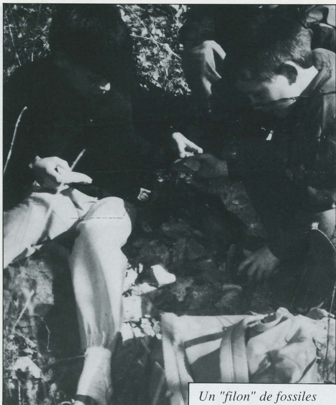
Un "filon" de fossiles

Pour les enfants, le plus difficile à vivre est sans doute l'obligation de se mettre à l'écoute des autres, de se plier aux exigences de la vie en collectivité, loin du cocon familial, d'adopter d'autres règles de vie que celles auxquelles ils sont habitués et enfin de trouver leur place au sein du groupe.