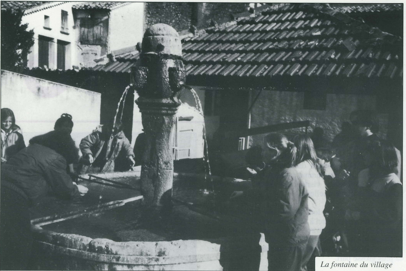
La fontaine du village

Un bon petit déjeuner pour bien démarrer la journée ▼