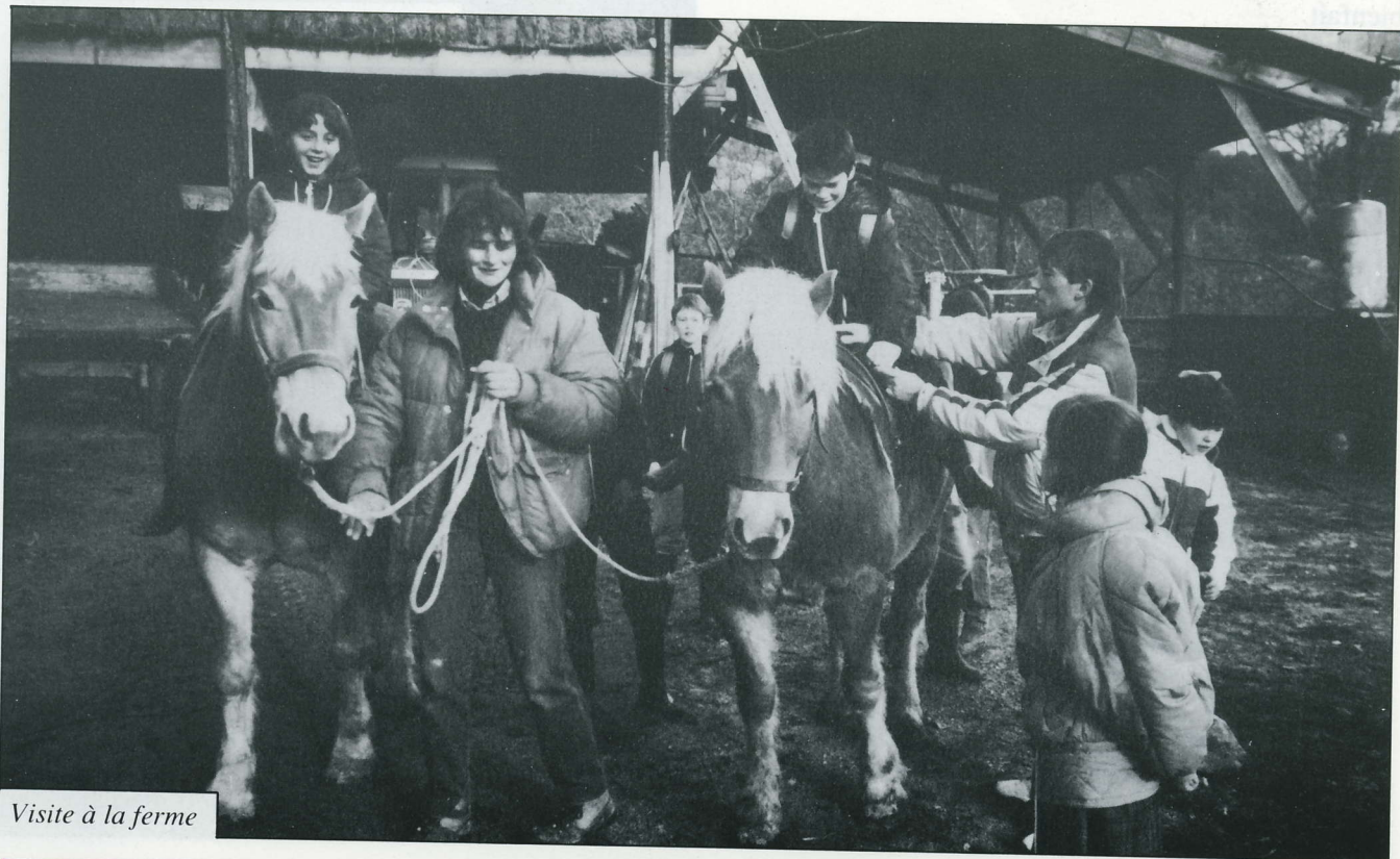
Visite à la ferme

Outre les acquis dans les disciplines découvertes lors de ce séjour, cette expérience est à tous points de vue enrichissante pour les enfants comme pour leur institutrice et tout enseignant devrait pouvoir en connaître une semblable. Les comportements des enfants s'y révèlent sous un jour nouveau et les rapports enseignant/enseignés s'en trouvent modifiés de manière très profitable.