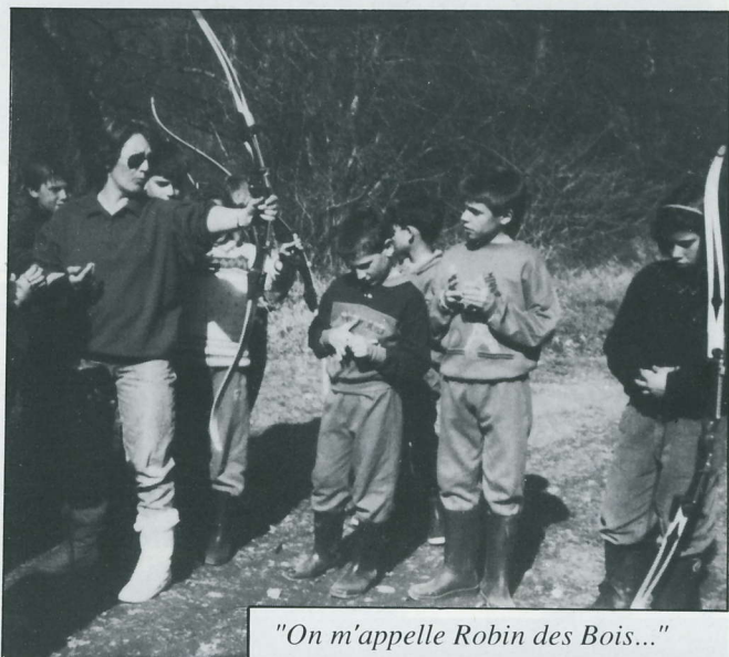
"On m'appelle Robin des Bois..."