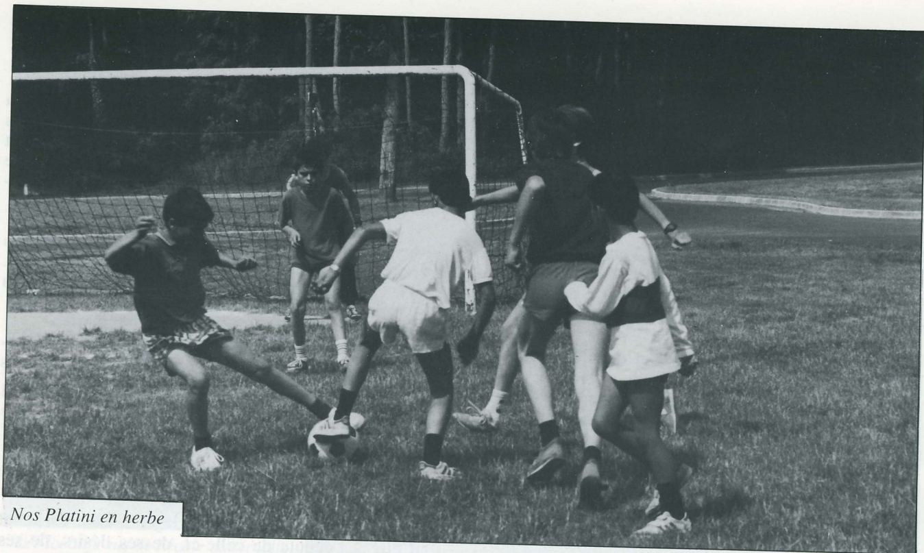
Nos Platini en herbe