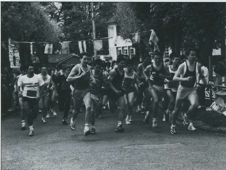
Le départ de l'épreuve reine des Foulées de Livry : les 10 kilomètres

Le dimanche 9 avril, l'U.S.L.S. a encore fait très fort pour la seconde édition des Foulées de Livry. De très nombreux participants, de tous âges et de différents clubs, s'alignaient au départ dans les diverses épreuves s'échelonnant au cours de l'après-midi, jusqu'aux 10 kilomètres, bouquet final de la journée.