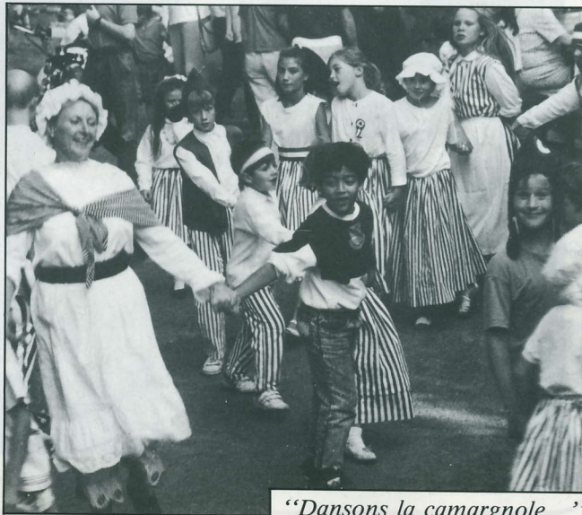
"Dansons la camargnole..."