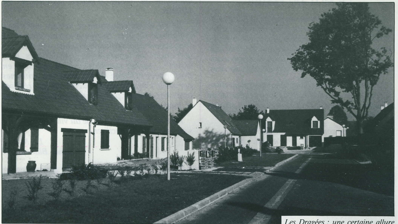
Les Dragées : une certaine allure

Grâce aux efforts soutenus du maire, le bassin de rétention a pu être curé et bétonné, ce qui diminuera les nuisances causées aux riverains. Des végétaux ont été plantés, qui donneront l'aspect paysager définitif après quelques saisons de végétation.