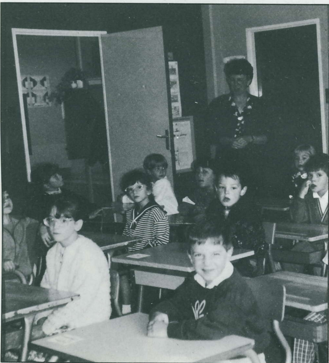
Rentrée au cours préparatoire : cette année, on apprend à lire !

A quelques jours de la rentrée on dénombrait cent dix-neuf inscriptions en primaire, pour quatre classes : de quoi avoir quelques inquiétudes. Ce n'est que le jour même de la rentrée que l'ouverture de la cinquième classe était autorisée par l'inspecteur d'académie, de sorte que nos enfants peuvent apprendre dans de bonnes conditions.