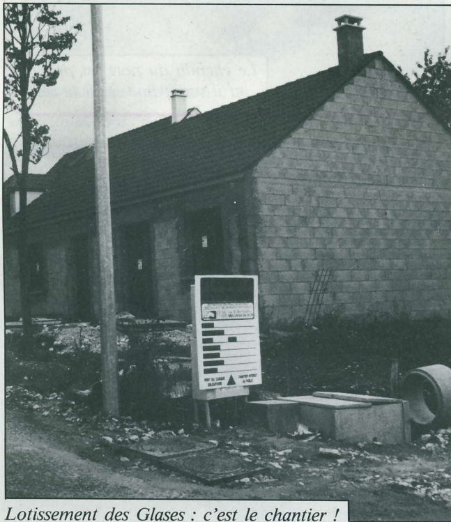
Lotissement des Glases : c'est le chantier !

Là aussi il faut attendre la réalisation définitive ; un chantier n'est jamais esthétique.