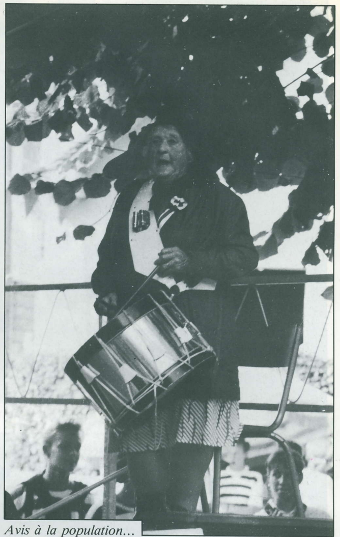
Avis à la population...

Et la fête continue, d'abord aux accents de la fanfare de Verneuil-l'Étang, tout de bleu-blanc-rouge vêtue. Pêche à la ligne, chamboule-tout où l'on peut abattre aussi bien Danton que Louis XVI ou Robespierre, quilles. Dans la salle paroissiale, une exposition retrace les principaux moments de la Révolution au plan national et propose dans des vitri-