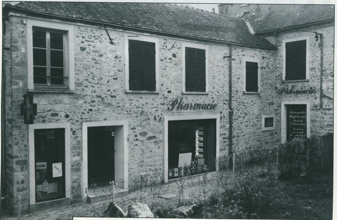
Une pharmacie moderne dans les vieilles pierres de la Villa du Nil : une réussite esthétique