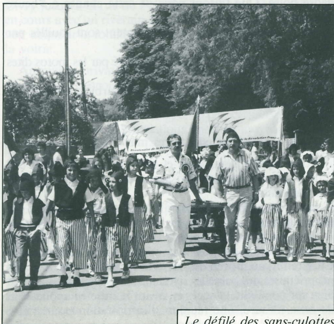
Le défilé des sans-culoïtes

Qui pourrait se douter aujourd'hui que la fête de l'école a failli ne pas avoir lieu ? Un peu de lassitude, peu de volontaires, le doute qui s'installe, tous les ingrédients de l'abandon. Et puis, comme toujours dans notre village, un appel aux bonnes volontés et tout repart !