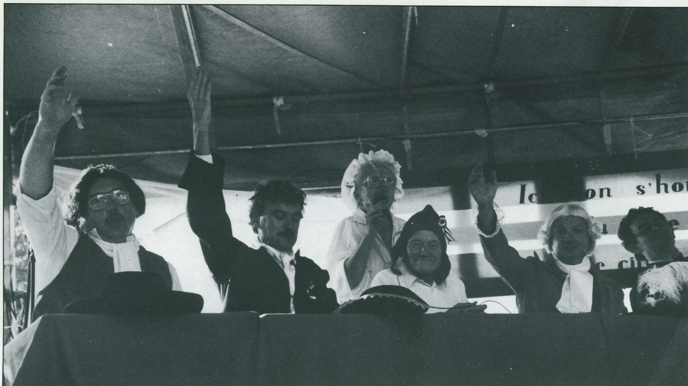
Le corps municipal dans sa "pluralité" approuve la nomination d'un maître d'école