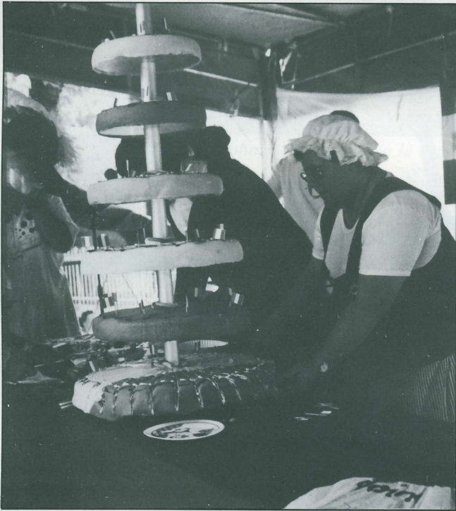
Deux cents parts de gâteau à découper, c'est pas de la tarte

A midi, la buvette a déjà écoulé la totalité des moules marinières, on frôle la rupture de stocks côté frites, il n'y a presque plus de pain et les réserves de boisson s'amenuisent avec une belle cadence ! C'est là que les choses sérieuses commencent. On annonce l'apéritif bleu, blanc, rouge, puis le repas. C'est la ruée vers le pot-au-feu. Grandiose ! Les cent cinquante convives réunis autour des tables, le sans-culotte remplissant obligeamment le verre de la marquise assise en face de lui – laquelle lève le coude avec autant d'assurance que Mlle de Sombreuil devant le tribunal révolutionnaire –, savourent le festin préparé par le citoyen Charly (M. Godefert, traiteur, rue Mouton à Livry, publicité gratuite). Festin qui s'achève sur le, ou plutôt les gâteaux tricolores, savoureux. Pour en terminer avec le repas, signalons qu'il reste des étiquettes de bouteille, s'adresser à Ph. Bailly.