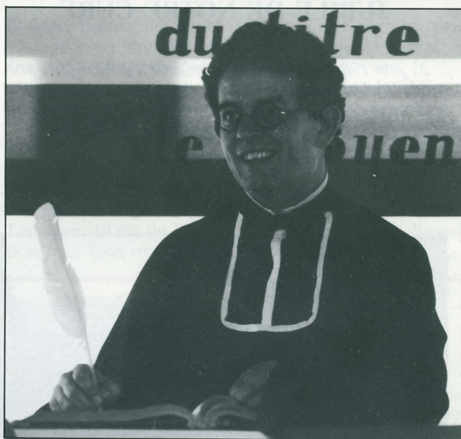
Greffier, inscrivez !