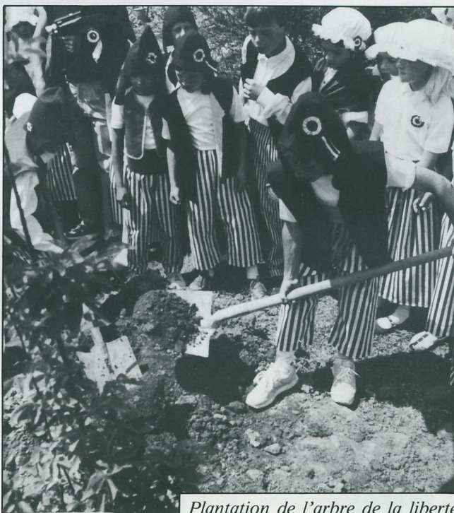
Plantation de l'arbre de la liberté

C'est ainsi que sous le soleil de ce 17 juin pouvait démarquer le défilé révolutionnaire qui, au travers des rues du village, devait nous ramener dans le parc de l'école primaire, non sans avoir cueilli en passant à la maternelle un bouquet de petits sans-culottes et de charlottes un peu effrayés par tout ce chahut.