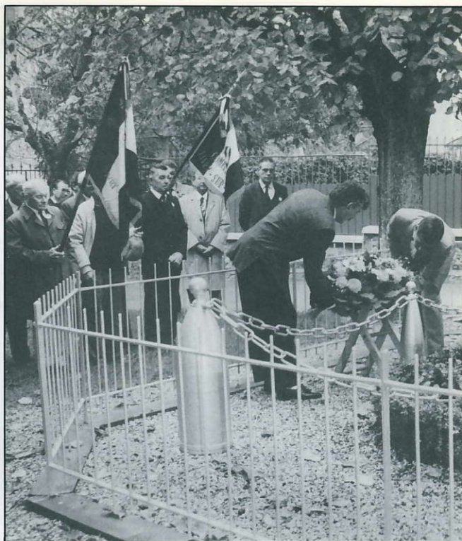
Le 11 novembre, dépôt de gerbe au monument aux morts.