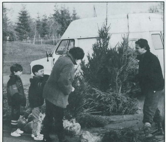
En décembre, vente de sapins au bénéfice de la Caisse des écoles.

Comment faire ? Présentez-vous à la mairie muni du livret de famille ou d'une fiche familiale d'état civil et de votre carte d'identité ou votre passeport.