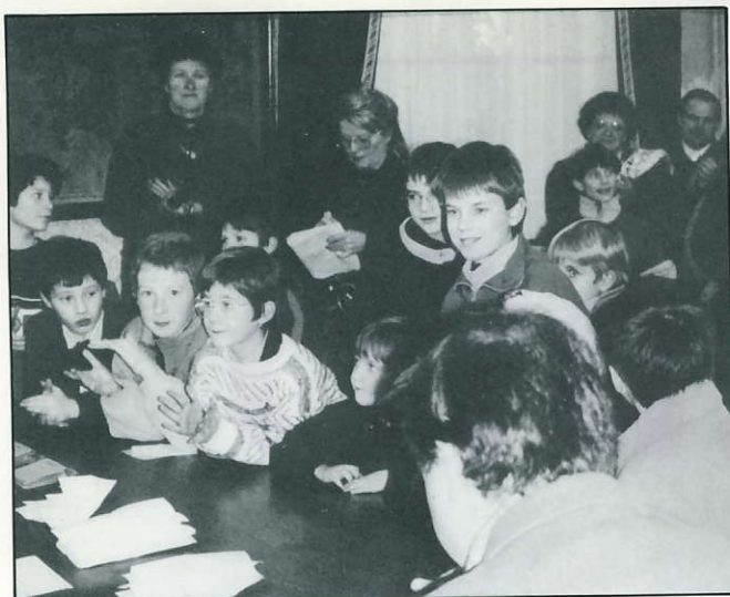
Assistance nombreuse et attentive pour le dépouillement.

Parmi ces projets, tous ne se concrétiseront pas ; d'autres peuvent se raccorder sur des structures existantes susceptibles d'amélioration, certains sont tout à fait dignes d'être retenus. Il faudra donc à nos jeunes apprendre à faire des choix, à définir des priorités, dur apprentissage de la vie.