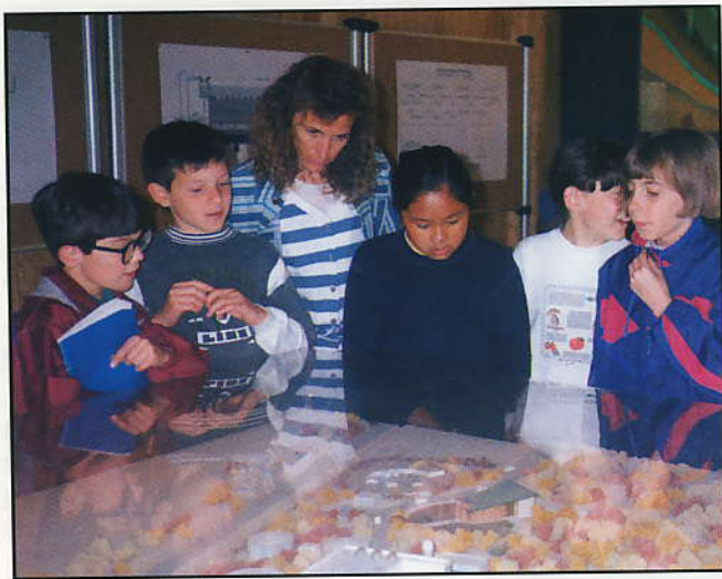
Cette histoire d'eau laisse les enfants - comme la maîtresse - perplexes.