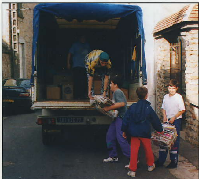
Les jeunes ont donné un sérieux coup de main, le 7 octobre, pour le ramassage des vieux papiers.

L'écologie bien comprise, c'est aussi cela. Faisons l'effort de trier nos déchets, la nature et nos finances ne s'en porteront que mieux. ■