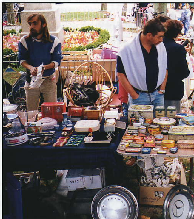
Échantillons de parfum, vieilles boîtes de cacao ou plaques émaillées publicitaires, les collectionneurs sont à la fête et font des affaires