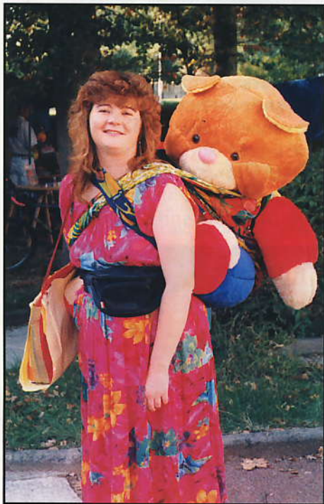
Ce gros nounours était à gagner lors de la kermesse du foyer-résidence le 8 octobre.