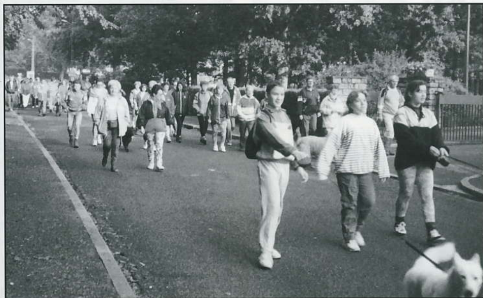
Le départ de la grande randonnée d'automne le 17 septembre.