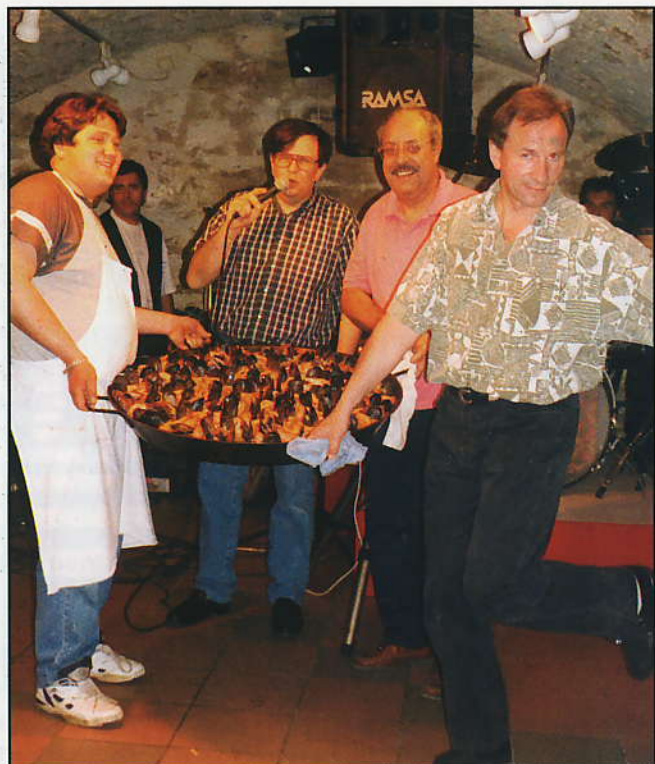
Ça c'est de la paëlla !...

Si la pluie a un peu gâché la fin de la journée, les exposants remballant précipitamment sous des trombes d'eau, la matinée et le début de l'après-midi furent propices aux chineurs, brocanteurs et autres amateurs de vieilleries en tout genre. Du train électrique au napperon en dentelle en passant par les vieux disques et les outils inutilisables, on pouvait trouver son bonheur sur les étals de la centaine d'exposants. Une petite futée à même déniché un stock d'échantillons de parfum de la maison Houbigant - célèbre dans les Années folles -, dont M. Javal, ancien châtelain et maire de Livry jusqu'à la guerre, était l'un des directeurs.