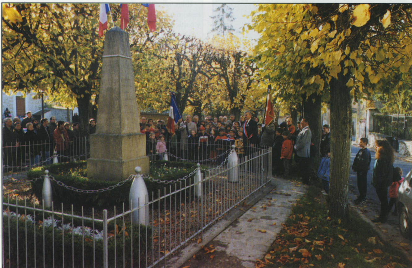
Les Livryens s'étaient déplacés nombreux le 11 novembre pour la commémoration du quatre-vingtième anniversaire de l'armistice de 1918, dont une soixantaine d'enfants et de parents, à la grande satisfaction des anciens combattants.

- Les riverains de l'avenue du Bois-de-Givry se plaignaient depuis un certain temps des confusions causées dans la distribution du courrier par la présence d'une double numérotation, les mêmes numéros se retrouvant en partie haute pour les maisons appartenant au Clos de Givry et en partie basse pour les maisons appartenant aux Dragées. Soucieux de résoudre ce problème, le conseil municipal a décidé de