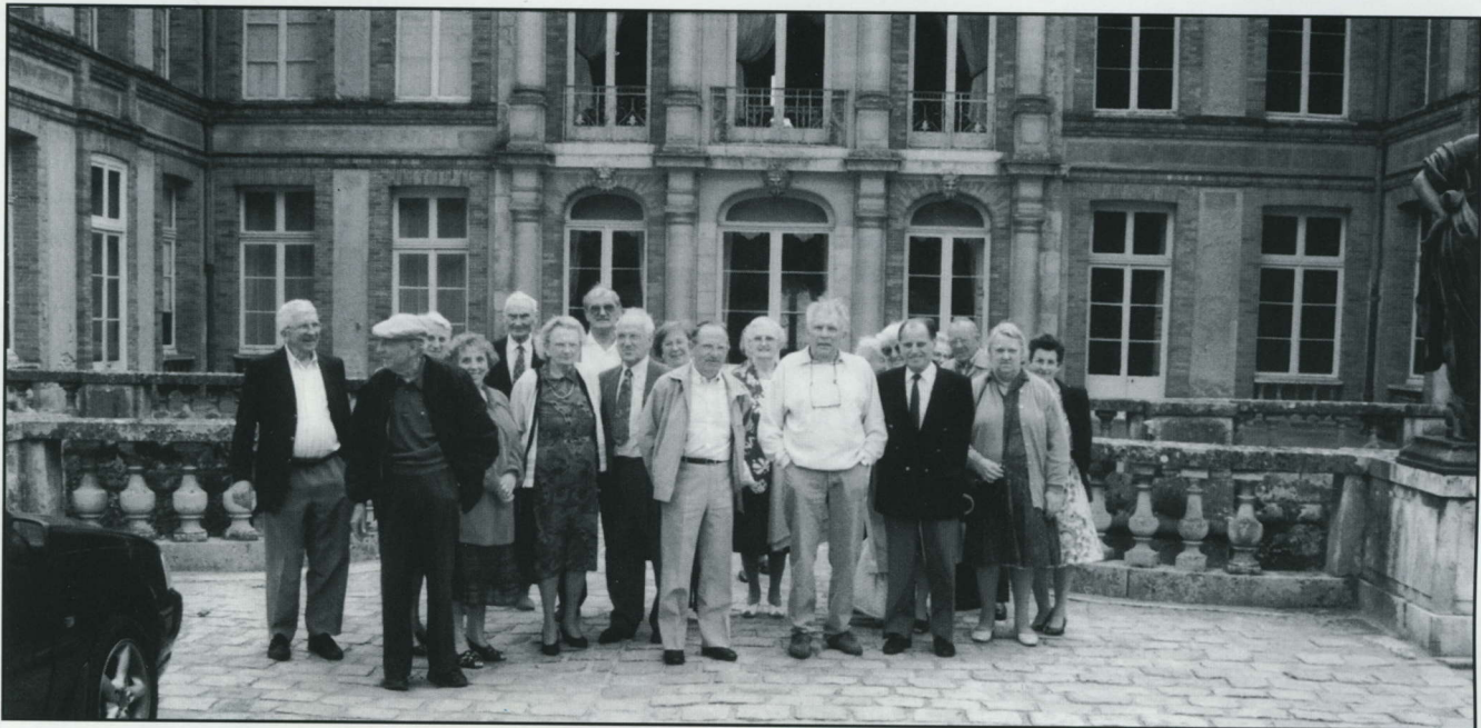
Le voyage annuel de nos anciens les a menés en juin dans la vallée de Chevreuse, avec visite du château de Dampierre.

● Le C.C.A.S. offre aux Livryens et Livryennes âgés de 75 ans et plus un colis de Noël qui leur sera porté à domicile par un membre du C.C.A.S.