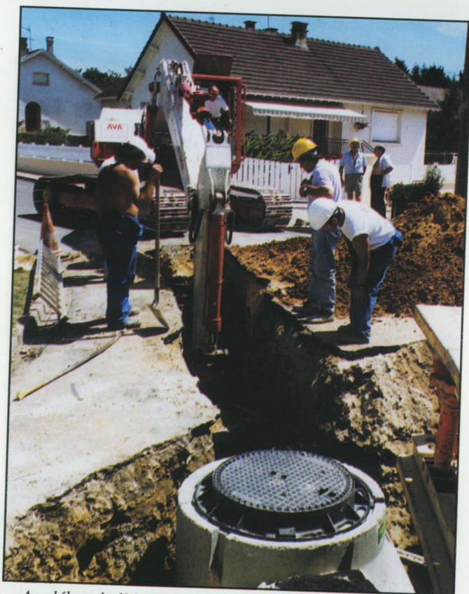
Au début de l'été, travaux de remplacement du collecteur d'eaux usées avenue Javal.