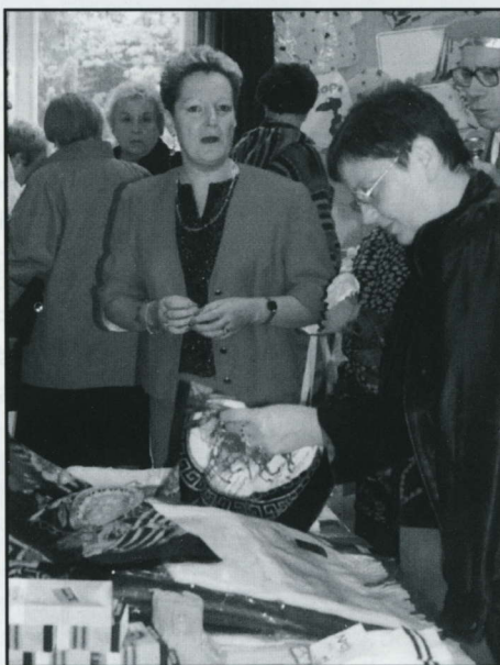
M me la directrice du foyer-résidence a le sourire : la kermesse bat son plein (4 octobre) !