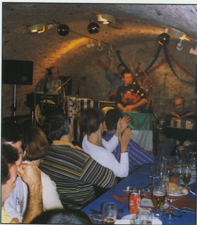
Chaude ambiance à la cave de la Villa du Nil lors de la soirée irlandaise : Guinness is good for you, isn't it !