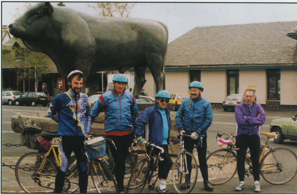
Les vaillants cyclistes de l'A.L.J.E.C. à Laguiole (Aveyron).