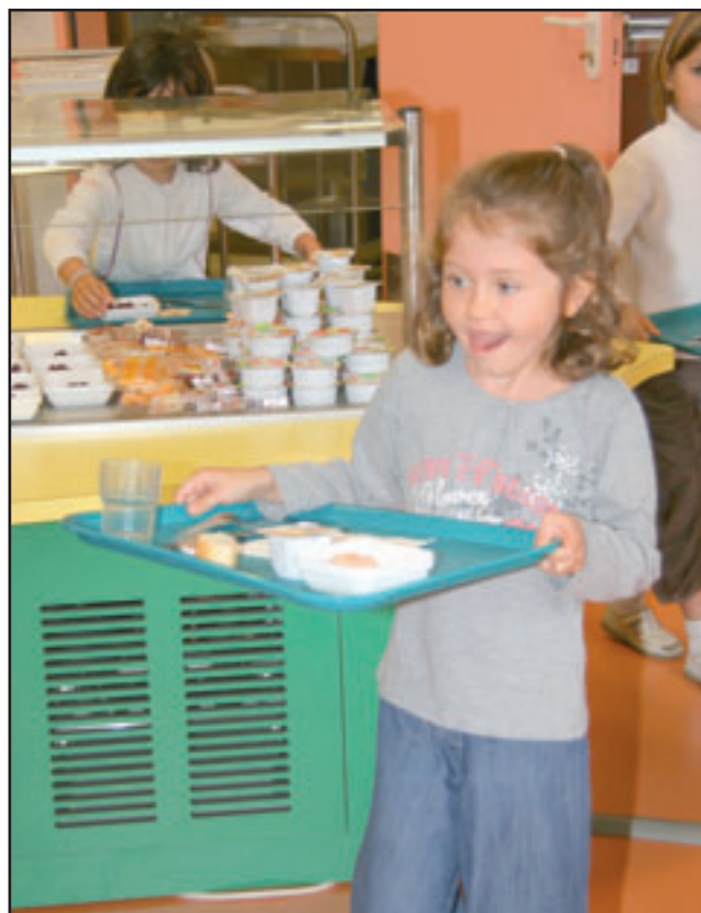
Comme les grands, on se sert soi-même au self du restaurant scolaire.