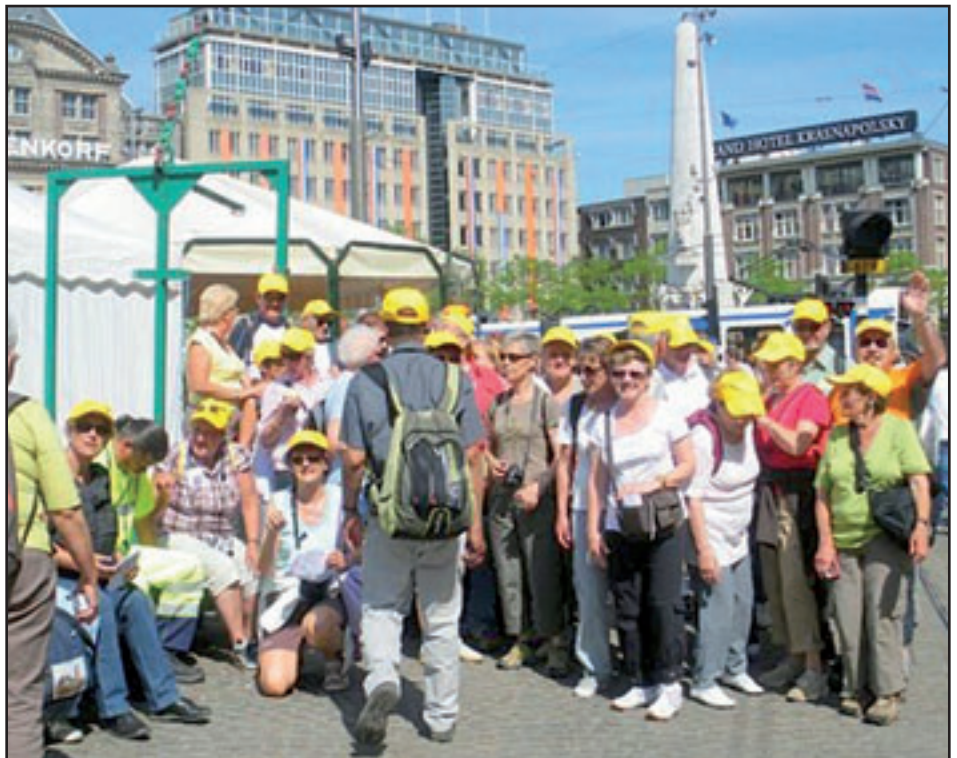
Les joyeux marcheurs de l'USL sous le soleil d'Amsterdam.

rentabilité mise en avant par l'ESF ayant fait perdre à celles-ci beaucoup de la convivialité qui faisait leur charme, continuez à donner votre sang, ou rejoignez - pour les autres -