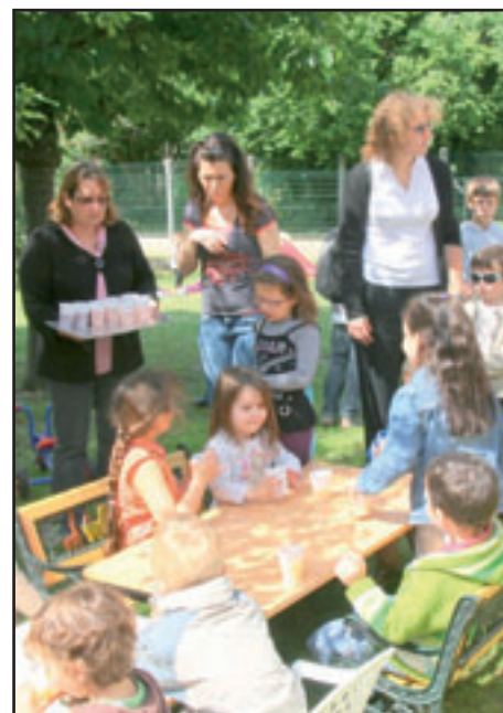
Un joyeux pique-nique.

Le traditionnel pique-nique s'est déroulé le 16 juin par une belle journée dans une ambiance chaleureuse et conviviale, pour le grand plaisir des petits et des grands.