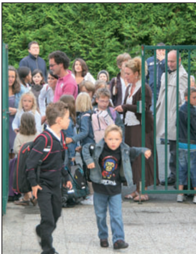
Rentrée des classes sans problème, en maternelle comme en primaire.