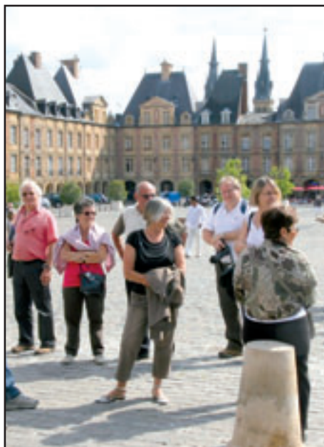
Le groupe sur la place ducale de Charleville, réplique de la place des Vosges à Paris.

La prochaine collecte de sang aura lieu à Vaux-le-Pénil. Même si vous êtes dérouté par la nouvelle organisation de ces collectes, l'exigence de