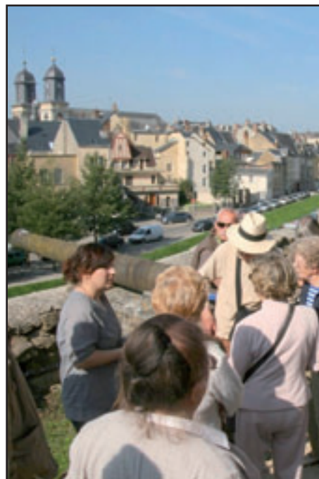
Vue sur Sedan depuis les remparts du château fort et, à droite, un aperçu des étonnants vitraux de la basilique de Mézières, créés par R. Dürrbach, ami de Picasso, entre 1954 et 1979.

les rangs des donneurs de sang. Ce geste sauve des vies, la vôtre peut-être demain, celle de vos proches, de vos enfants, pensez-y.