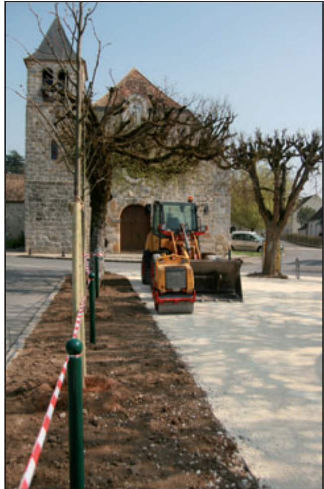
Nouveaux arbres, nouveau revêtement, bordures engazonnées, la place a pris un coup de jeune et après l'épisode pluvieux les boulistes ont réinvesti le terrain.