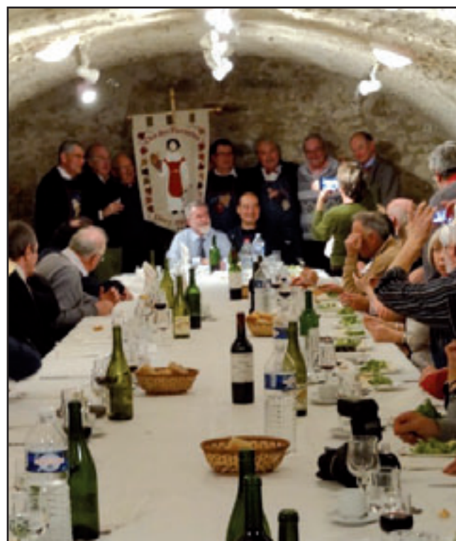
Après l'assemblée générale de Cocorico, le 11 février, un repas convivial a réuni les membres des confréries présentes dans la cave de la Villa du Nil.

Des membres de la confrérie ont participé, le 31 mars, au chapitre des Compagnons d'Irminon à Combs-la-Ville puis, le 7 avril, la cuvée 2011 du Clos des Pierrottes a été mise en bouteilles dans l'ambiance conviviale habituelle, un apéritif sous le soleil étant servi sur la place aux membres de l'ARVAL - et aux passants.