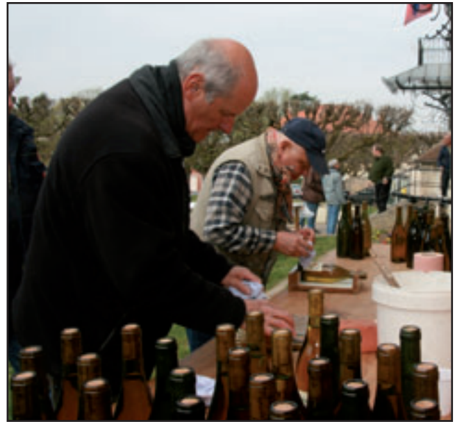
Le Clos des Pierrottes cru 2011, sitôt mis en bouteille, sitôt étiqueté... sitôt dégusté !

C'est après que les choses se sont gâtées. Peu après le débouillage de la vigne, les bourgeons ont subi le gel qui a sévi à plusieurs reprises au cours du mois et on peut craindre pour 2012 une récolte encore plus faible qu'en 2011. Après les fortes pluies du mois d'avril, le petit épisode de grêle de début mai n'a rien arrangé. Il faut maintenant attendre pour voir si, la météo s'améliorant, de nouveaux bourgeons apparaissent pour limiter les pertes.