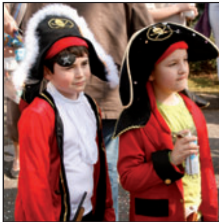
Carnaval ensoleillé le 24 mars.

Les Foyers ruraux de Seine-et-Marne, dont fait partie l'ALJEC, avaient choisi Livry pour cadre du rallye pédestre qu'ils organisaient le 7 avril : une cinquantaine de marcheurs ont traversé l'ENS, longé les bords de Seine jusqu'à Chartrettes et découvert notre village avant de partager au retour un apéro dinatoire en écoutant des contes et quelques airs de cornemuse.