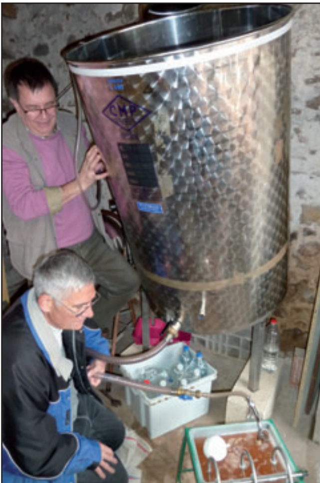
Ne pas en perdre une goutte.