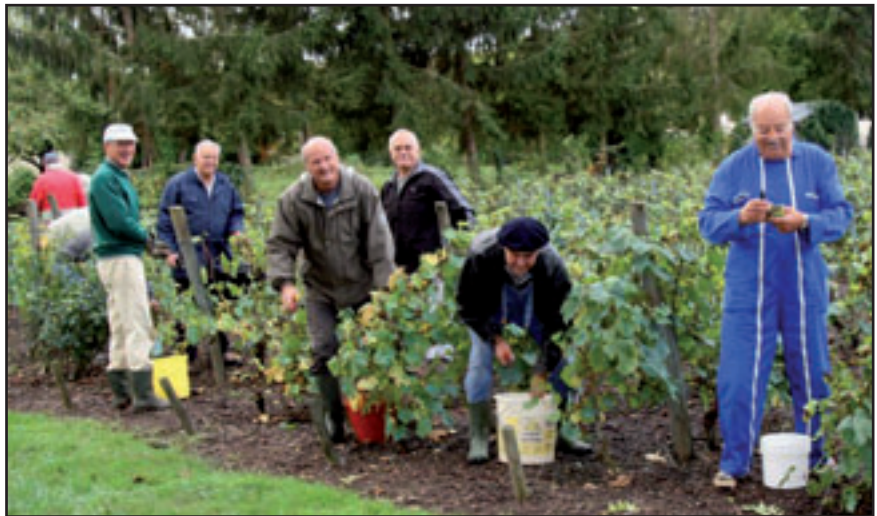
Vendanges dans la bonne humeur le 12 octobre pour les vigneronns de l'ARVAL mais petite récolte : peu de raisin suite aux pluies surabondantes du printemps.

Le 13 octobre, près d'une centaine de Livryens sont venus salle Dumaine suivre l'exposé par les élus et les architectes des différentes options possibles pour l'aménagement des extérieurs (parc, réseaux, stationnement...) du Fief du pré ainsi que des premières réflexions sur le bâtiment existant avec les diverses contraintes concernant en particulier l'accès aux personnes à mobilité réduite. La question de la vitesse de circulation dans le village a également été abordée en fin de réunion.