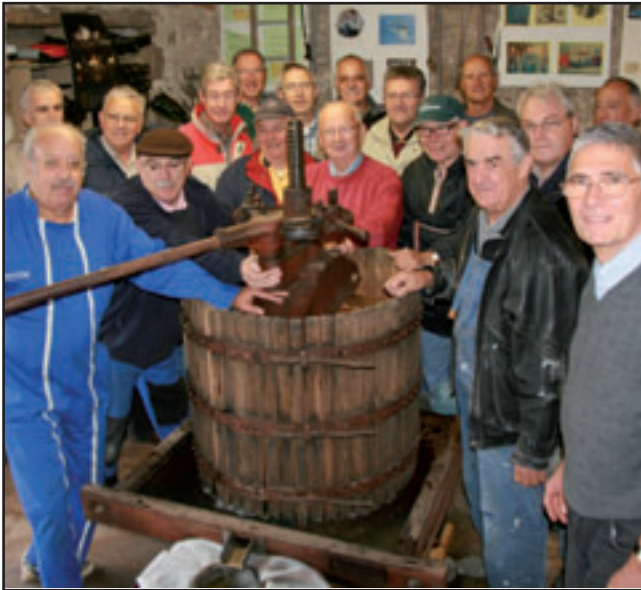
Les vigneron de l'ARVAL autour du pressoir.