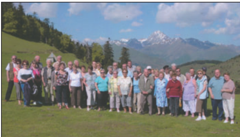
Ci-dessus le groupe devant la chaîne des Pyrénées et, ci-dessous, en compagnie des amis de Semur-en-Auxois.