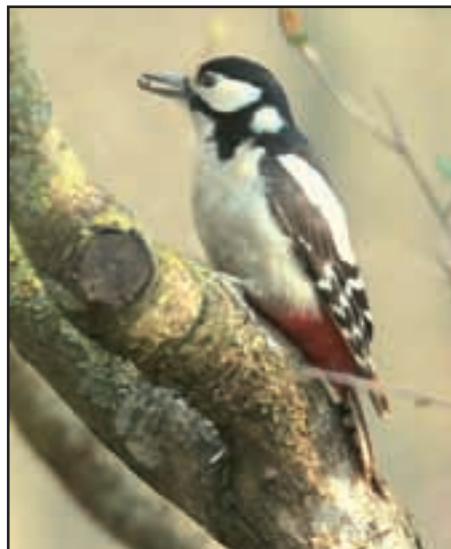
Pic épeiche femelle