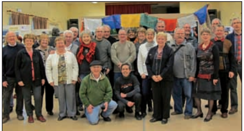
Prêt au départ, le groupe des vaillants randonneurs de l'ALJEC...

Le 16 mars, le Salon du voyage a permis de découvrir de nombreux pays.