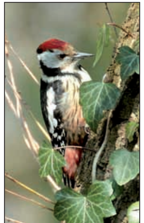
Le pic mar, magnifique oiseau