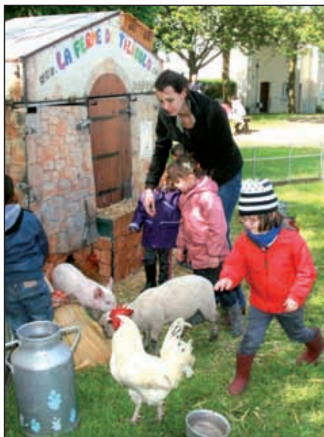
Gros succès pour la ferme pédagogique à la maternelle le 22 mai : poussins, lapins, poules, canards, oie, goret, et le petit agneau, trop mignon... Quant à la chèvre, elle a montré bien de la patience, tous les enfants s'essayant à la traire tour à tour !