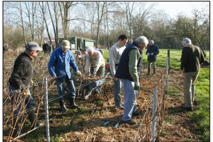
La taille de mars