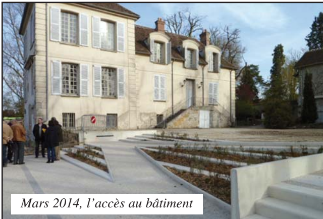
Mars 2014, l'accès au bâtiment