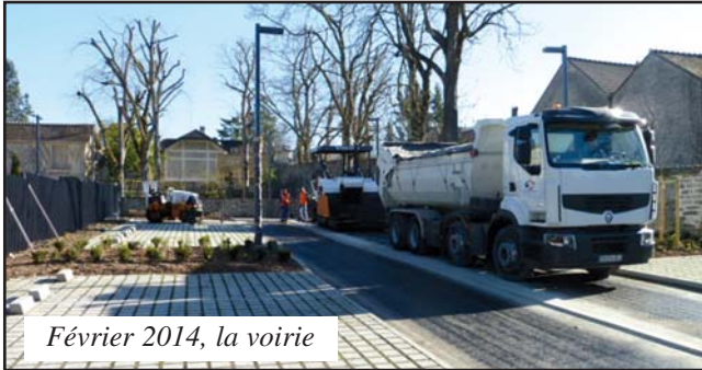
Février 2014, la voirie