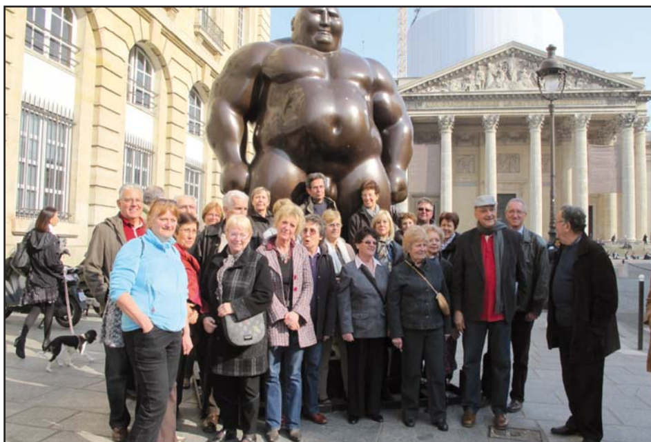
Sortie des « jeudis de l'ALJEC » à Paris (près du Panthéon).

qui vous sont proposées dans notre village