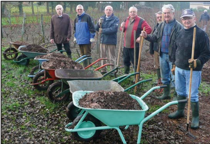
A chacun sa brouette, travaux d'entretien durant l'hiver dernier.

ce « millésime ». Une petite gelée d'avril a cependant touché quelques pieds mais ceci ne devrait pas avoir trop de conséquences sur la récolte future. Tout dépendra maintenant de l'ensoleillement d'été. Le repas des vendanges est prévu le samedi 4 octobre.