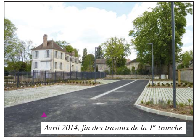
Avril 2014, fin des travaux de la 1 re tranche