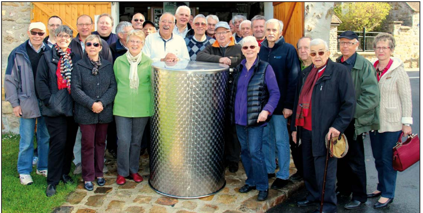
Tout sourire après la mise en bouteilles du 5 avril.