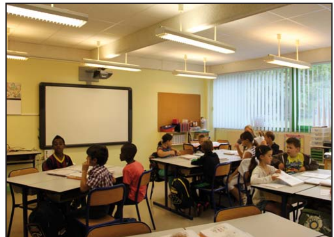
Le nouveau TBI (tableau blanc interactif) en cm1/cm2 A