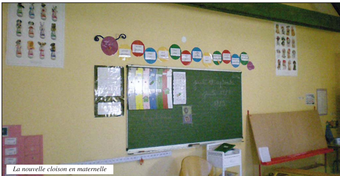
La nouvelle cloison en maternelle