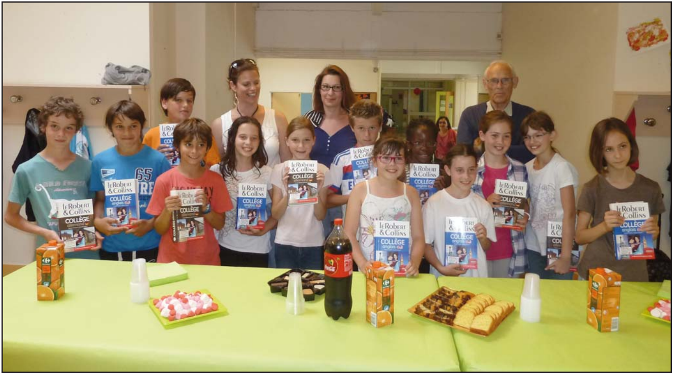
Le 1 er juillet, remise des dictionnaires aux élèves de CM2.