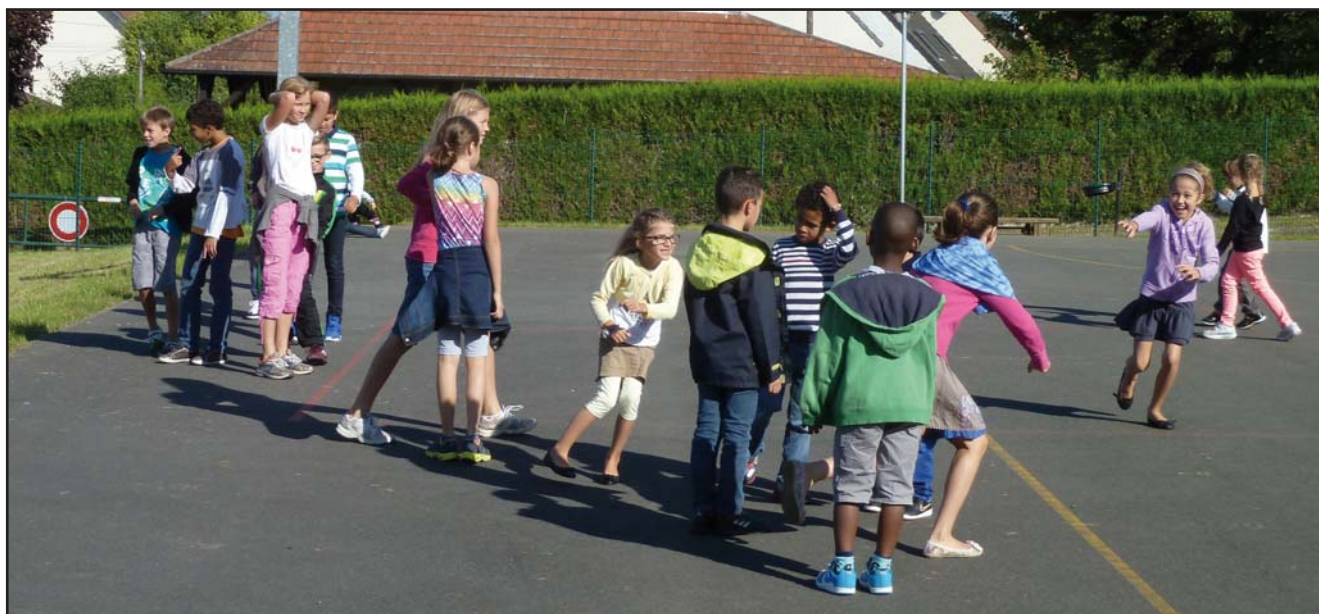
Rentrée scolaire 2014, en photo : la première récréation le mardi 2 septembre à 10 h 30. Une actualité à retrouver en page « du côté des écoles » et en page « travaux ».