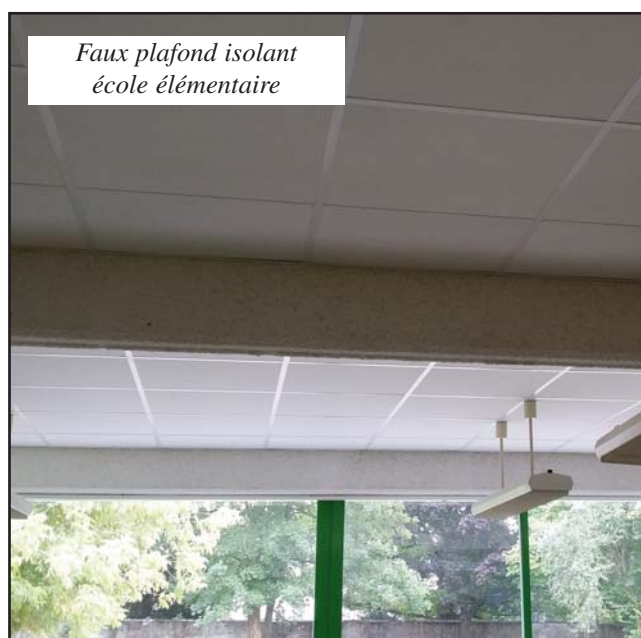
Faux plafond isolant école élémentaire

Du côté de l'élémentaire, deux nouvelles classes ont été équipées de faux plafonds pour améliorer l'isolation phonique et thermique permettant aux élèves de travailler dans une ambiance calme.