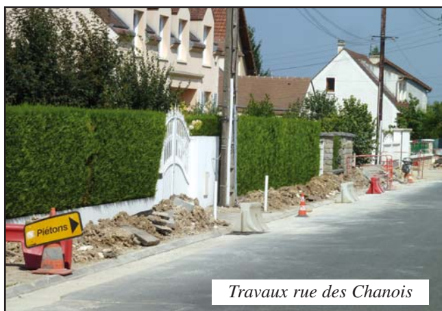
Travaux rue des Chanois