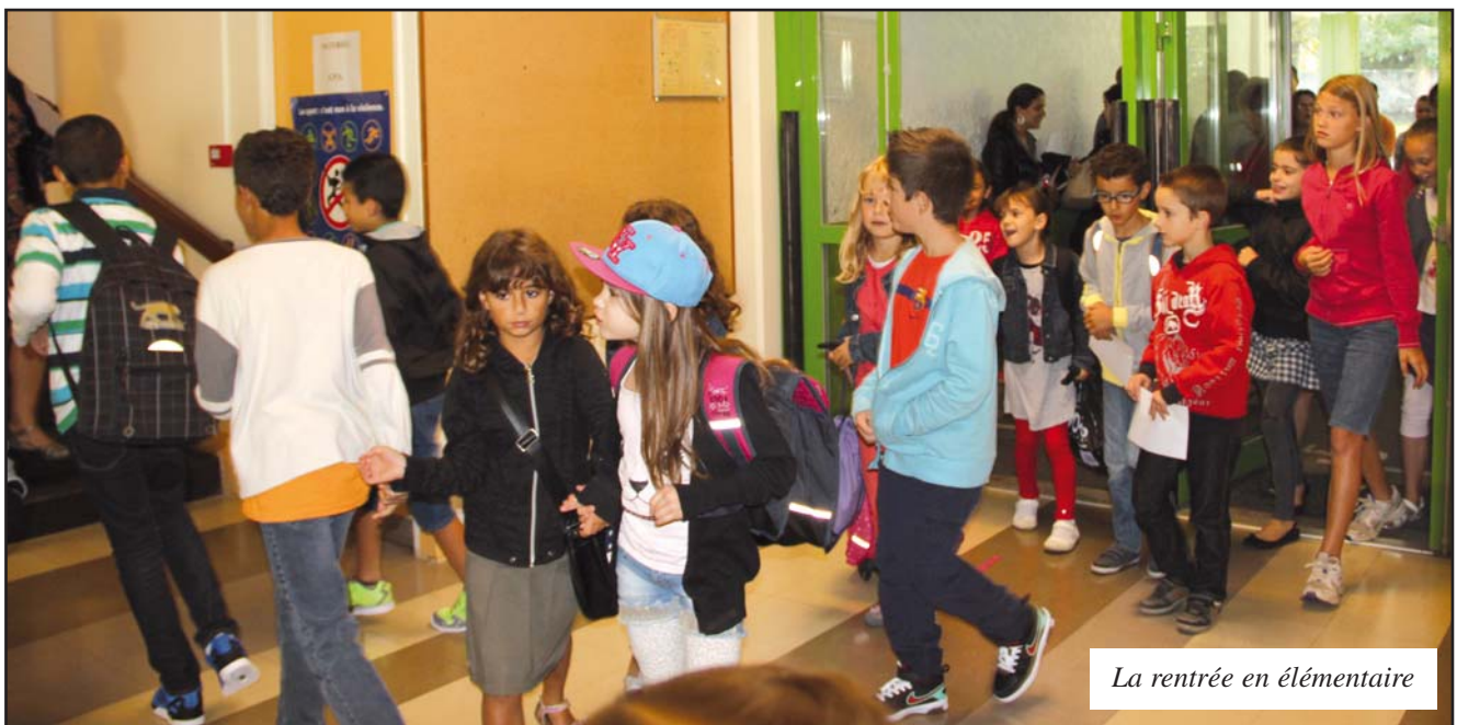
La rentrée en élémentaire