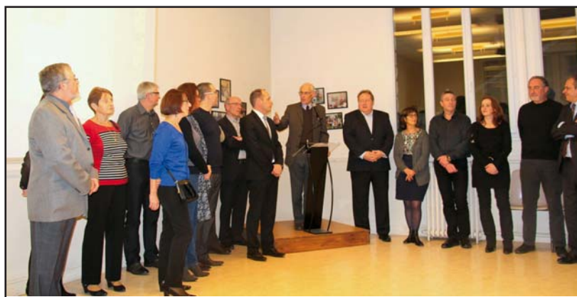
Les vœux du maire et du conseil municipal le 9 janvier en salle Dumaine.

Face à cette réduction importante et continue de nos recettes qui a débuté en 2011, notre gestion devra donc être très rigoureuse et économe. Le Conseil municipal devra préciser ses priorités dans ses objectifs d'investissement (scolaire, Fief du Pré...) et il devra définir le difficile compromis entre le maintien des services rendus et l'évolution des impôts communaux. Une décision sera prise le 20 mars, lors du vote du budget.