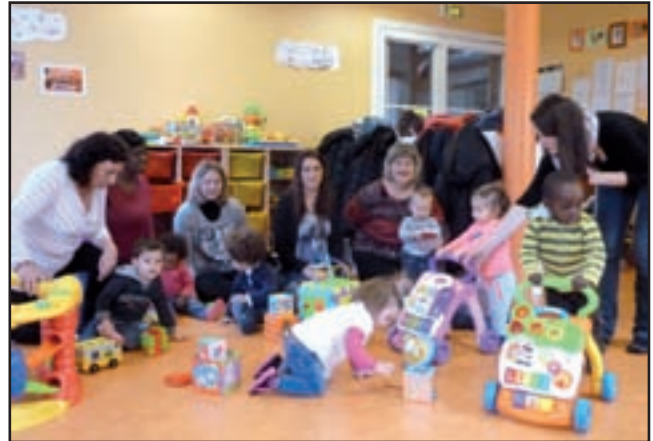
Les Minots dans leur salle d'activités

Les heures d'ouverture sont du lundi au vendredi de 9h à 11h30 et la moitié des vacances scolaires. Renseignements au 01 60 68 27 81.