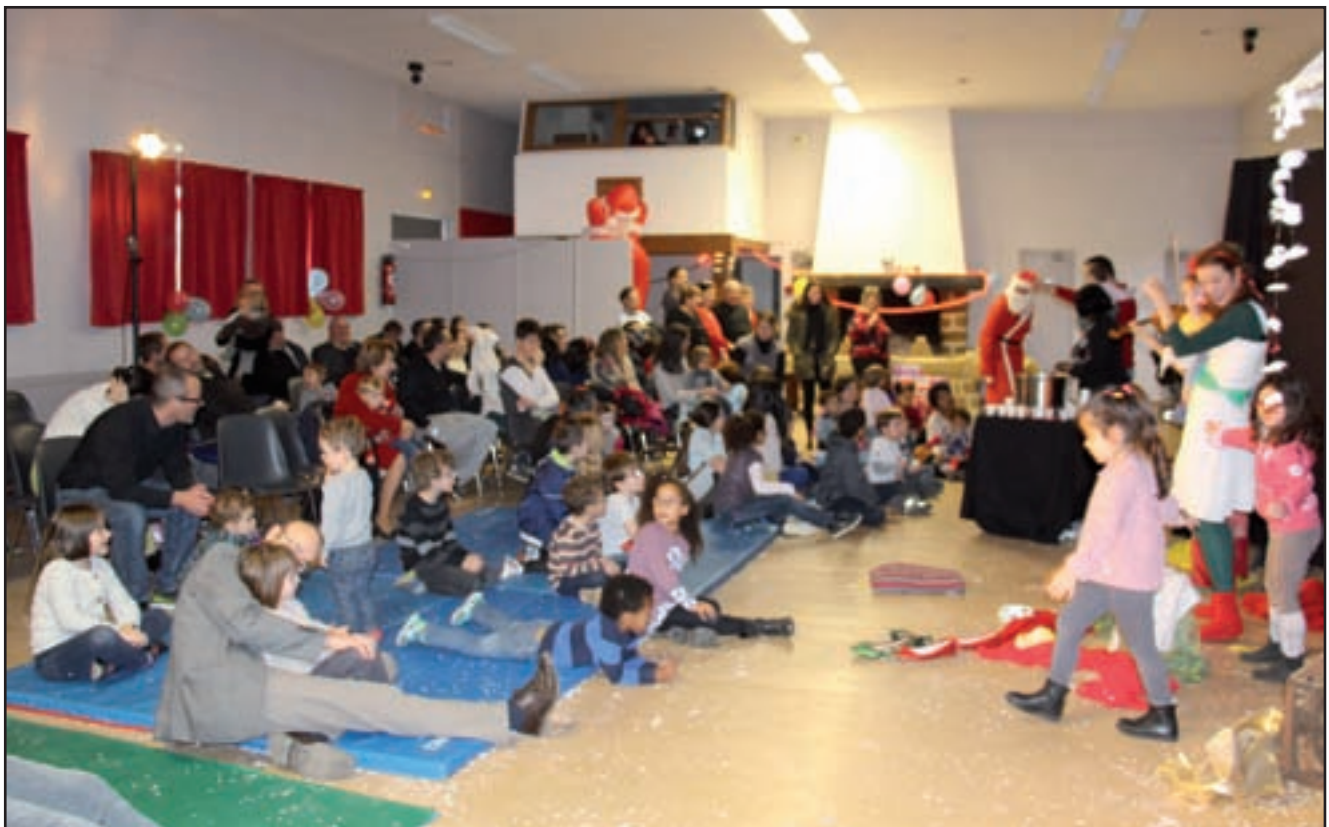
Le Noël des Minots avec leurs familles à l'ALJEC

Composition et impression : 01 64 06 90 12