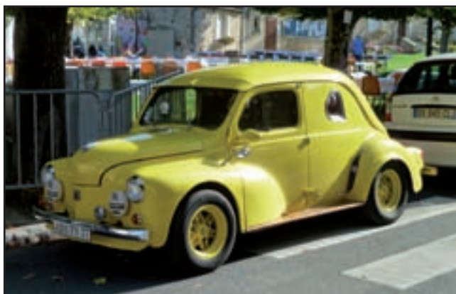
Belle 4 cv Renault sur la place du village lors du rassemblement des bikers