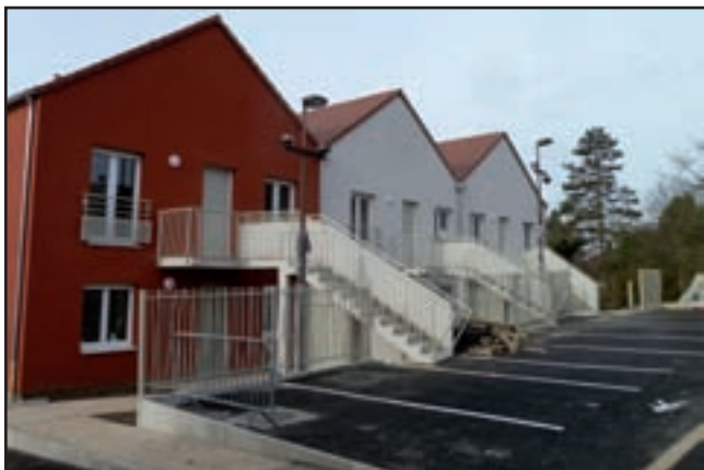
14 logements locatifs sociaux en cours de finition (photo de janvier) rue de Melun (bailleur FSM).