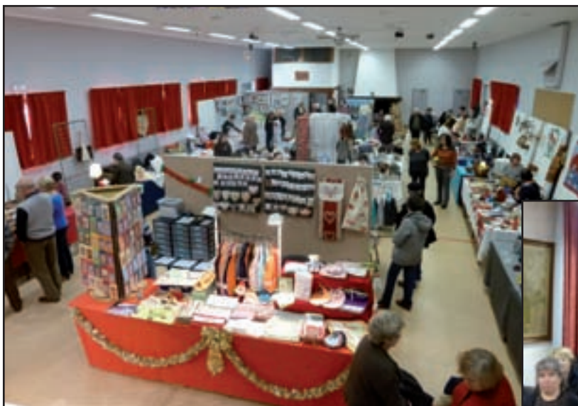
Encore un beau « salon d'art » le 22 novembre à l'ALJEC