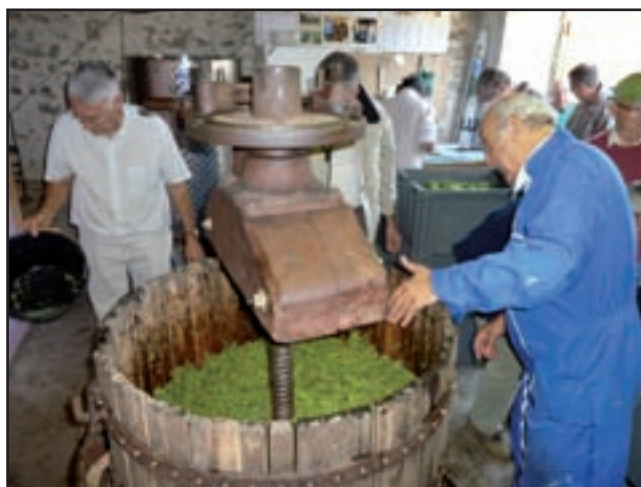
La récolte du Clos des Pierrottes, pressurée à l'automne 2015, sera mise en bouteilles le 2 avril prochain