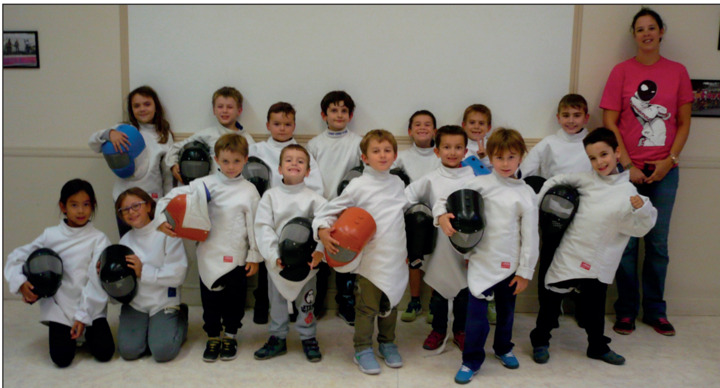
De jeunes escrimeurs très motivés en tenue complète et prêts à en découdre ! Les champions n'ont qu'à bien se tenir...