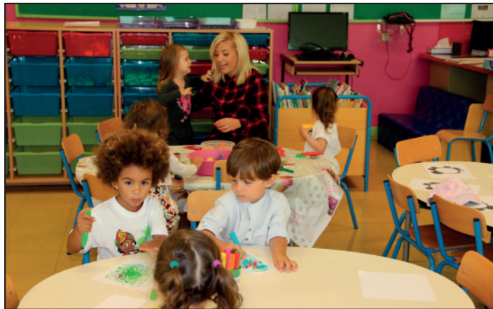
Classe « petite section » : pendant que certains sont déjà au travail d'autres ont besoin d'un petit câlin.