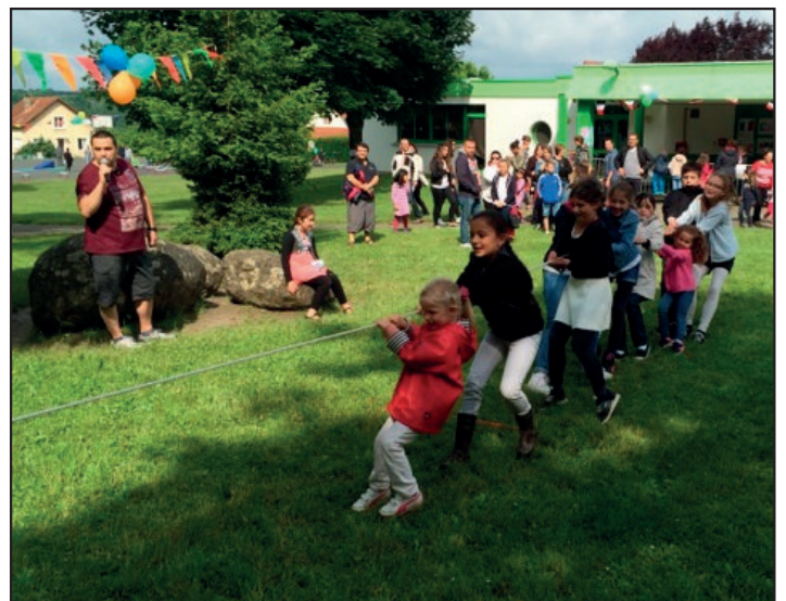
L'équipe met toutes ses forces dans la bataille pour remporter la victoire.