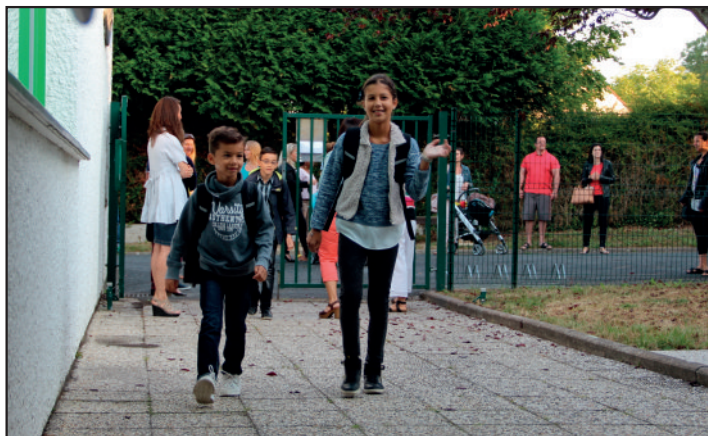
La rentrée à l'école élémentaire, les enfants ont le sourire.

Dès le 30 août, toute l'équipe du périscolaire s'est réunie pour organiser et préparer l'accueil des 193 enfants, soit 73 en maternelle et 120 en élémentaire. En fin de réunion, les directrices des écoles sont venues se joindre à l'équipe pour échanger entre autres sur les questions de sécurité.