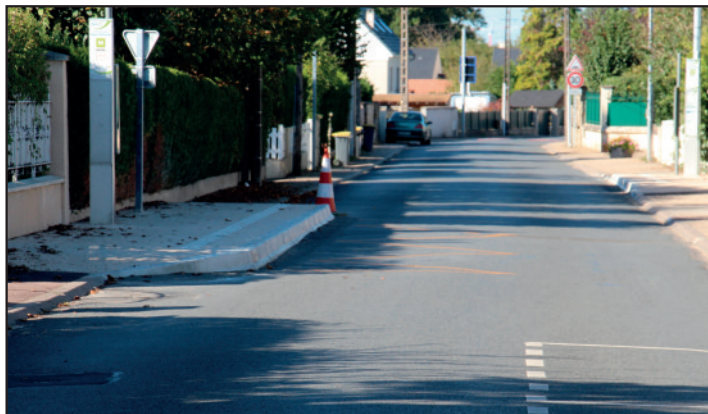
Rue de Vaux, les arrêts de bus ont été réhaussés.

Rue de Vaux les deux derniers arrêts de bus de la ligne M ont été mis aux normes d'accessibilité cet été, selon le programme défini par la CAMVS. La route est donc un peu moins large, ce qui oblige les véhicules à ralentir pour se croiser.