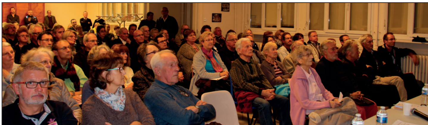
Plus d'une centaine de personnes assistait à la première réunion de présentation de révision du PLU.