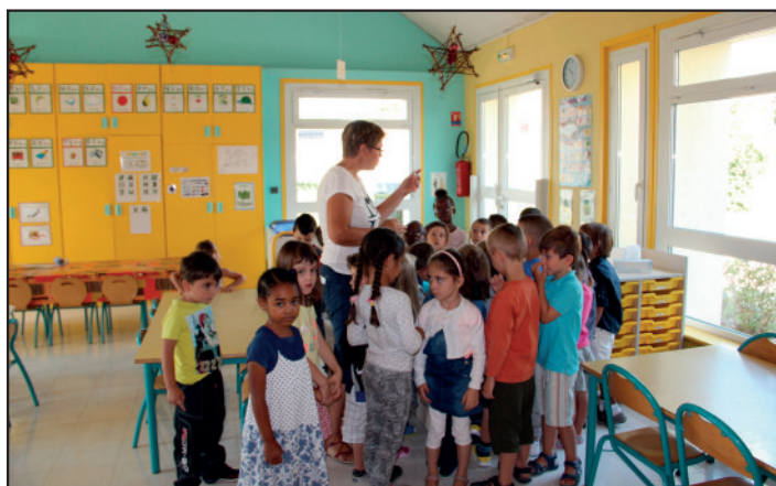
La classe « Grande Section » : dernières consignes avant la récréation.