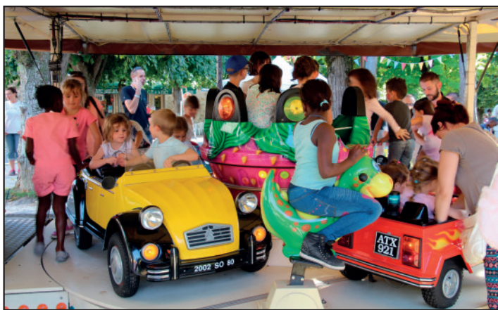
En route pour l'aventure en 2-chevaux ou en soucoupe...