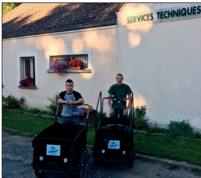
Un véhicule électrique bien pratique et l'entretien de la commune est plus écologique!