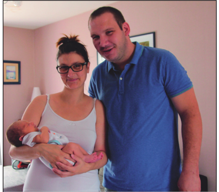
Les heureux parents d'un Livryen pur souche !

Pour fêter cette arrivée en fanfare, la commune a félicité les parents en leur offrant un bouquet de fleurs. Nous souhaitons beaucoup de bonheur à cette belle famille.