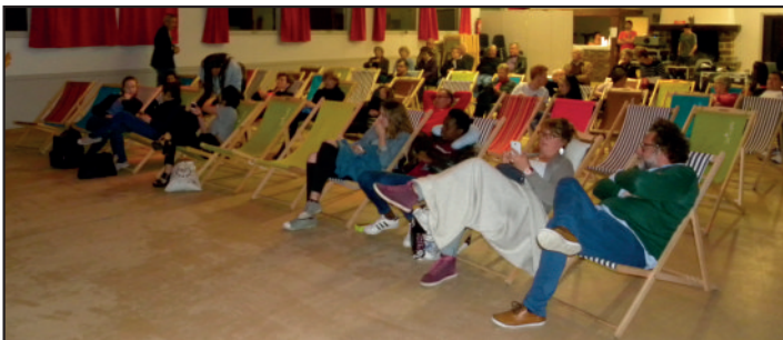
Une quarantaine de cinéphiles prêts à apprécier la séance.