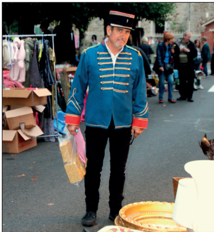
Le placier, en grand uniforme, veille à ce que chacun trouve son emplacement au plus vite pour le bon déroulement de la journée : organisation sans faille.

En ce dimanche un peu pluvieux les chineurs étaient pourtant bien présents sur la place du village à la recherche de la perle rare. Les saucisses et les frites, préparées par le comité d'animation, ont permis aux exposants de tenir le coup toute la journée pendant que les enfants ont passé leur temps dans une structure gonflable à la grande joie de leurs parents !