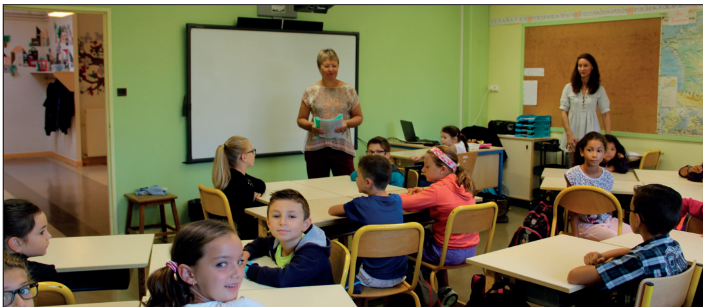
Le troisième Tableau Blanc Interactif (TBI) a été installé dans la classe de Mme Fournier. Les enfants ont ainsi pu découvrir ce nouvel équipement encore plus performant que les précédents puisqu'il est tactile et permet d'écrire.