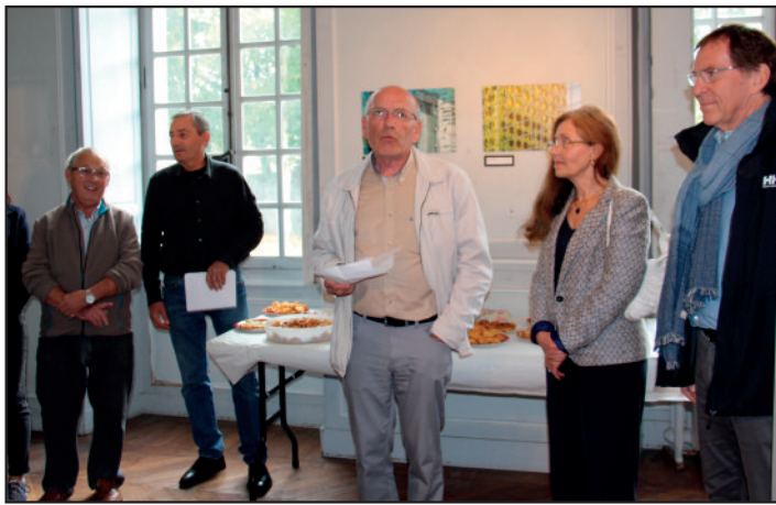
Discours de vernissage du maire en présence de Mme Beaulnes-Serini, conseillère départementale du canton de Melun, et de M. Mignon, député de la 1ère circonscription de Seine-et-Marne.