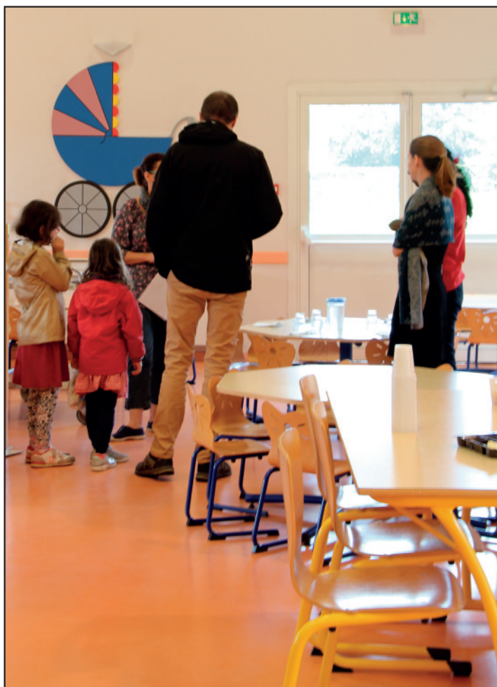
Les parents sont curieux de découvrir l'environnement de leurs enfants.

Une autre porte ouverte sera organisée pour les parents de l'école élémentaire le samedi 5 novembre de 10H à 12H.