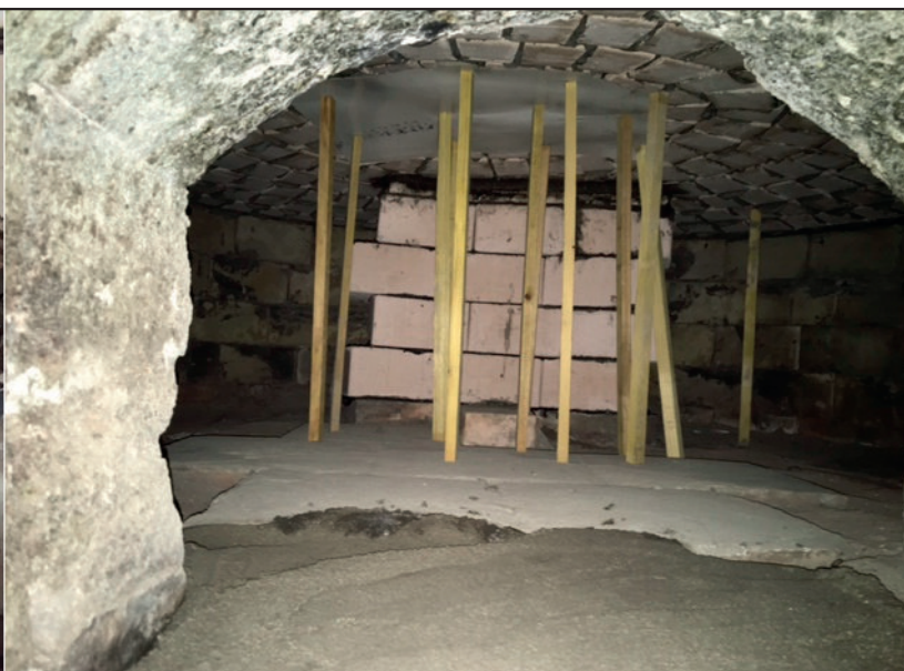
Il a fallu près de deux semaines de travaux par une entreprise spécialisée pour refaire l'intérieur du four à bois de notre boulangerie. Mais il en valait bien la peine ...