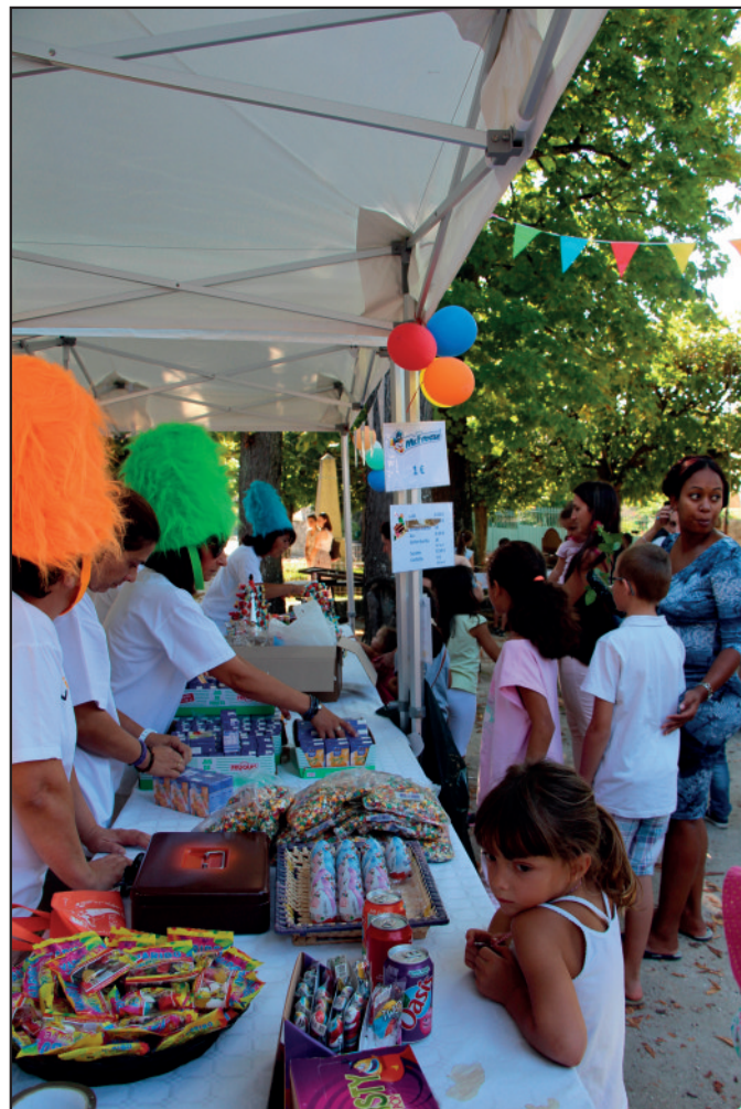
Un Livry en fête haut en couleur pour la plus grande joie des enfants.