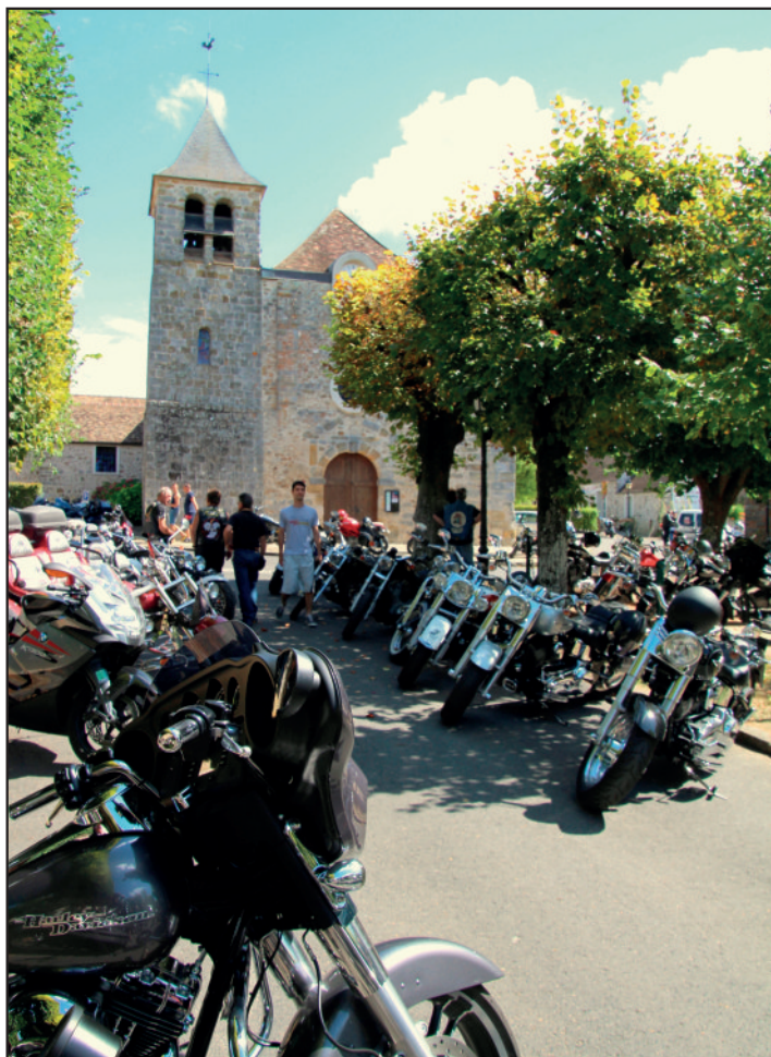
Chromes rutilants sur la place de Livry.