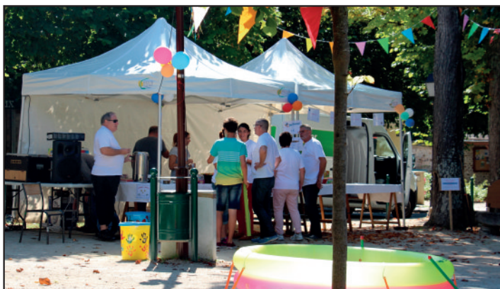
Installation sous un soleil radieux et dans la bonne humeur.

Un samedi matin ensoleillé de septembre, la place du village se réveille doucement mais pourtant un petit groupe d'irréductibles élus et d'employés communaux motivés s'agite. Des barnums s'installent, des ballons se gonflent puis un manège, des jeux en bois, de la musique se rajoutent.