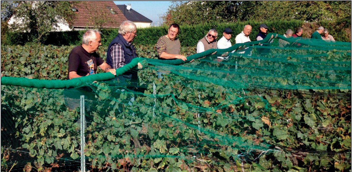
Protéger la vigne, un travail d'équipe! Quelques passionnés se sont retrouvés le 24 septembre pour protéger les précieuses grappes.