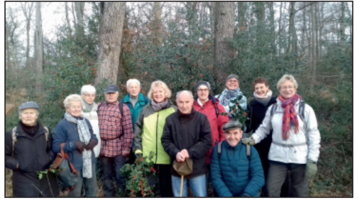
Un grand bol d'air et quelques kilomètres pour les randonneurs du jeudi.

Renseignements sur le site ALJEC ou Claude DAVID 06 82 32 85 65