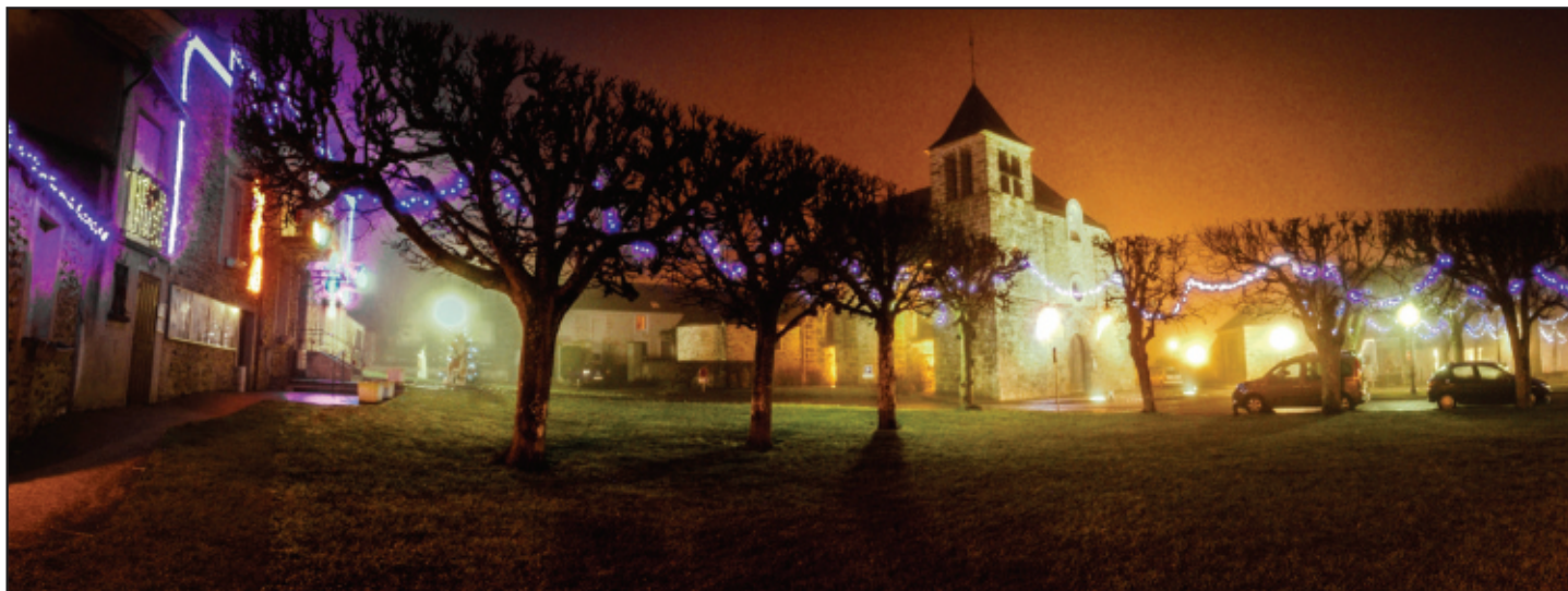
Par un soir brumeux de décembre, la place du village et ses illuminations de Noël.