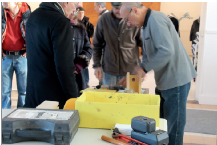
Montage de cinquante nichoirs à mésanges pour les habitants du quartier des Uselles afin de lutter contre les chenilles.

La sensibilisation aux écosystèmes par une conférence sur les papillons au foyer résidence « la Chesnaie », des conférences sur les Zones Humides en février, la création avec les enfants des écoles d'un livret sur la métamorphose des grenouilles, une autre conférence sur les chenilles processionnaires en novembre et la fabrication et l'installation de 100 nichoirs à mésanges sur la commune.