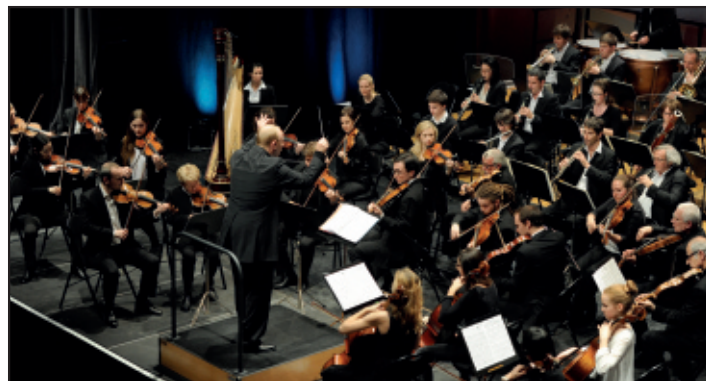
Cette année l'orchestre Melun Val-de-Seine fête ses 20 ans.

Dimanche 5 mars, 16h, amphithéâtre de la Reine Blanche, à Melun