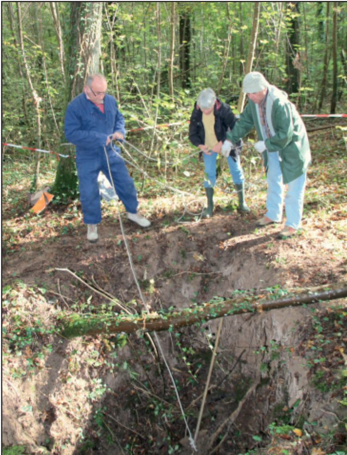
Etude du gouffre des bois de Livry par des spécialistes de l'archéologie.

Courant septembre 2016, un Livryen avertissait la mairie de Livry qu'une excavation s'était formée non loin du chemin du four-à-chaux, et qu'il convenait sans doute d'y aller voir de plus près, ce qui fut fait le 18 octobre, après avoir contacté le groupement de recherches archéologiques de Melun, qui déplaça sur le site trois de ses membres éminents.