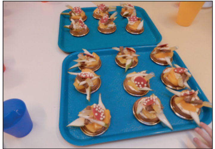
Ce goûter pour les maternelles a l'air très, très appétissant...

Tout commence avec une envie de partage. L'idée est de faire découvrir aux enfants de la maternelle qui vont en garderie l'activité et la passion de notre artisan pâtissier.