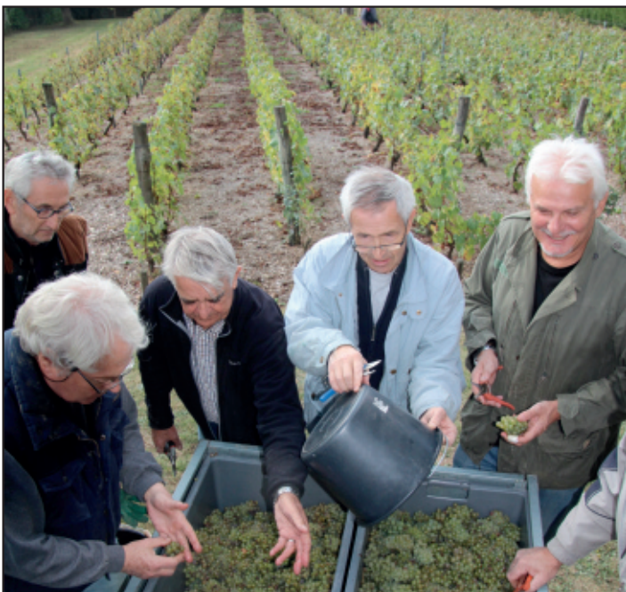
Les rares grappes sont chouchoutées par les vendangeurs.

Mise en bouteille et dégustation du cru 2016 du Clos des Pierrottes, au chai à 10h, samedi 1er avril 2017.