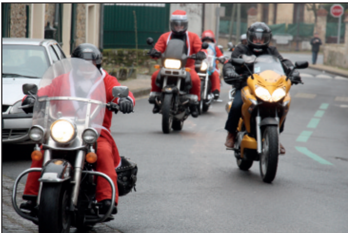
Retour d'une promenade en moto pour les amis du père Noël.

Si, si, le père Noël et ses remplaçants ont été aperçus en moto dans Livry ! Après une balade aux alentours, une pause au café sur la place puis une choucroute « made in » Lauverjon, ils ont repris leur route pour finir leurs préparatifs.