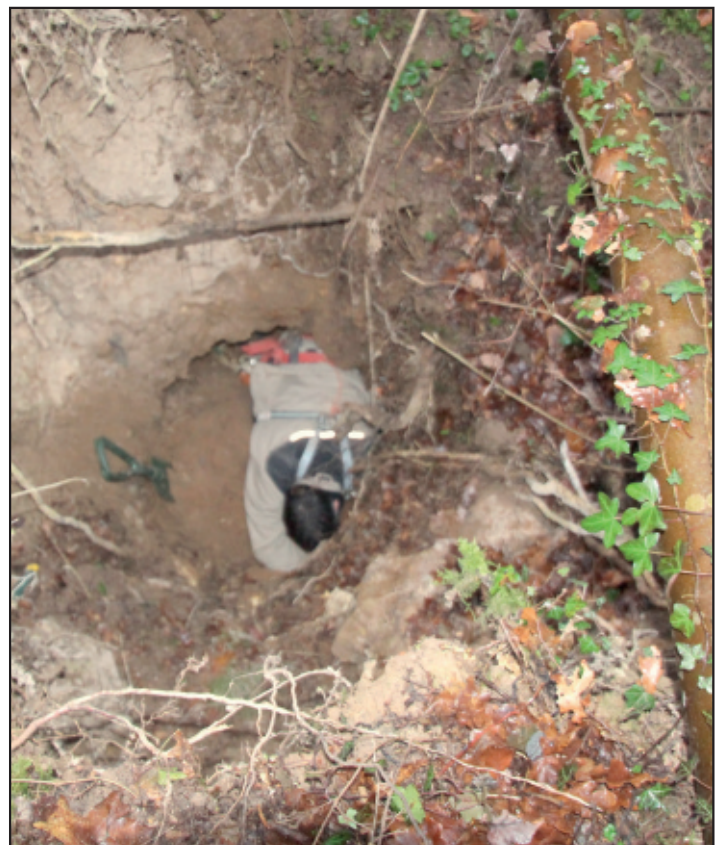
Que révélera l'étude de cette étrange cavité apparue dans les bois de Livry ?