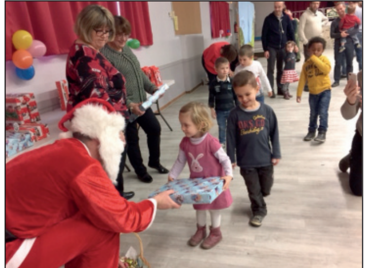
Une très belle surprise attendait les enfants de l'association.

Ensuite le père Noël est venu distribuer aux petits minots des cadeaux adaptés à chaque âge et des chocolats pour leurs frères et sœurs. Un grand goûter avec les parents a clôturé cet après-midi de fête.