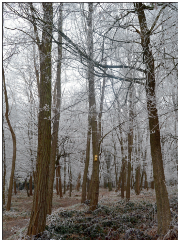
En janvier, le bois de la Garenne sous le givre.