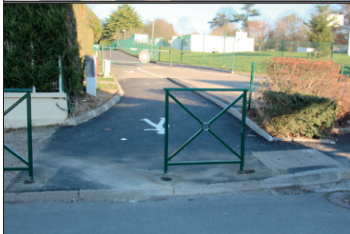
Avant : Des voitures sur le trottoir et des enfants sur la route... Après : Plus aucun véhicule sur le chemin des écoliers !