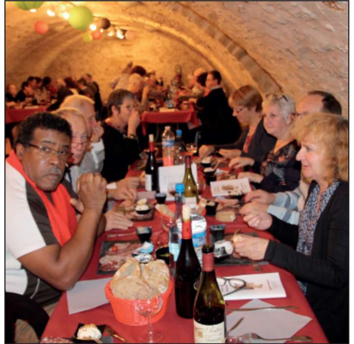
Une belle ambiance musicale pour fêter l'arrivée des vins nouveaux 2016.

Fête de la musique le 21 juin 19h sur la place