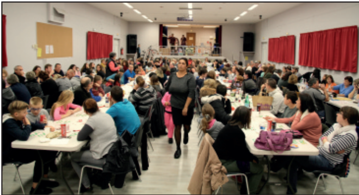
Salle comble et suspens insoutenable ...

Encore un grand succès pour le loto du comité d'animation qui a eu lieu dans la salle de l'ALJEC le 5 novembre. Tous les lots ont fait des heureux mais aussi des malheureux qui, à un numéro près, se voyaient déjà repartir en vélo ou avec un nouveau téléviseur! Beaucoup de perdants se sont consolés en dégustant de très bonnes crêpes et se sont donnés rendez-vous l'année prochaine.