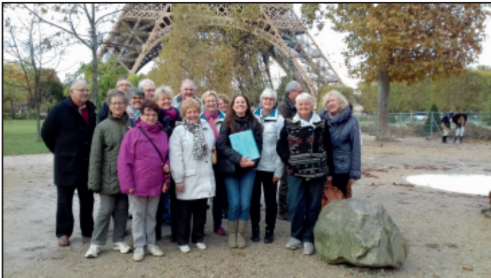
Une des nombreuses sorties des Jeudis de l'A.L.J.E.C

Vous voulez plus de détail avant de vous inscrire, consultez le site internet de l'ALJEC ou téléphonez au 01 60 68 40, J. Pillavoine.