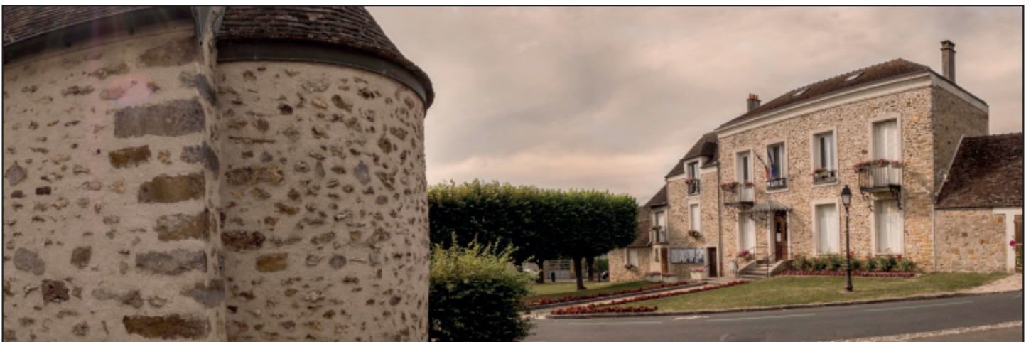
La place et la mairie en vue panoramique pour un avant-goût de l'exposition de la section image de l'ALJEC.