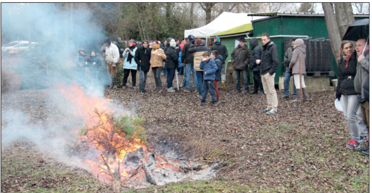
Sapin après sapin l'ambiance se réchauffe au pied du brasier. C'est une nouvelle année qui commence dans la bonne humeur.

Finalement avec une crêpe, un vin chaud ou un chocolat se fut mission accomplie ! Merci au comité d'animation pour ce chaleureux instant.