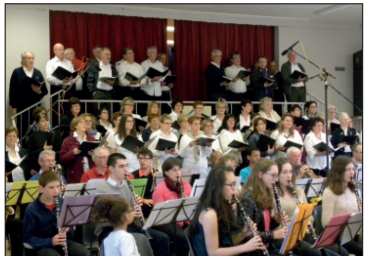
En 2016 plus de 100 personnes avaient assisté à ce concert.

Le même jour, les élèves de grande et moyenne sections de maternelle exposeront leurs travaux et même chanteront quelques morceaux accompagnés par les musiciens. Nous vous attendons nombreux.