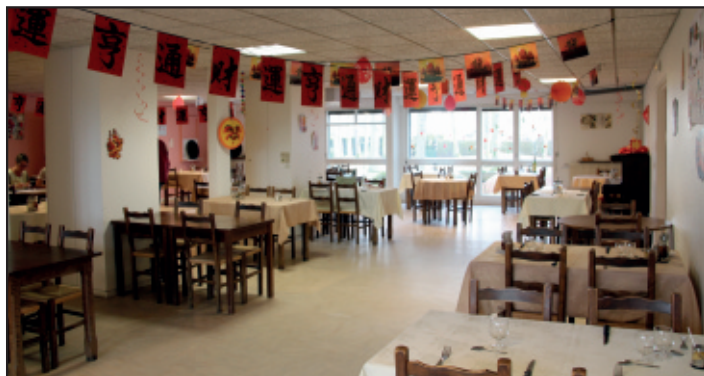
La salle à manger de la résidence pour le repas du midi.

Chaque appartement est équipé de prises de télévision, téléphone et d'un système d'alarme. Le résident est chez lui et apporte ses meubles et effets personnels.