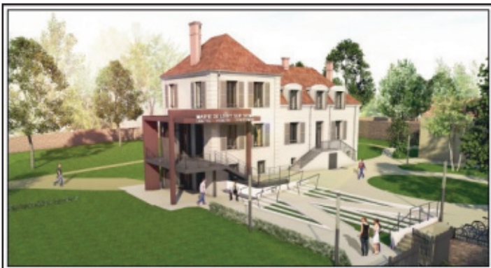
Parmi les projets 2017, le démarrage des travaux de la nouvelle mairie au Fief du Pré.

- Pérenniser les itinéraires de randonnée.