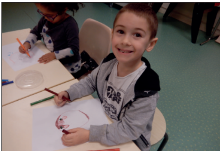
Puis un joli dessin du succulent gâteau tout juste dégusté...