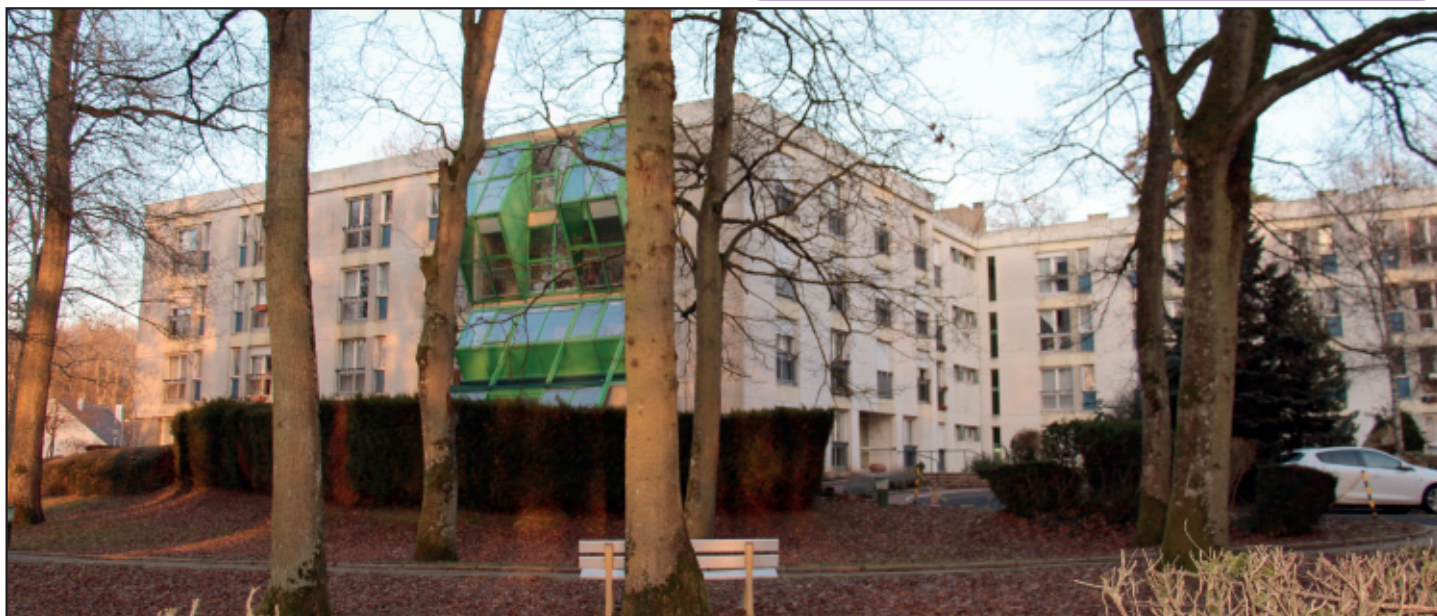
Le foyer résidence "La Chesnaie" accueille dans un cadre naturel les seniors qui veulent rester indépendants en toute sécurité.

Renseignements dans les CCAS du Syndicat Intercommunal de Gestion et de Fonctionnement.