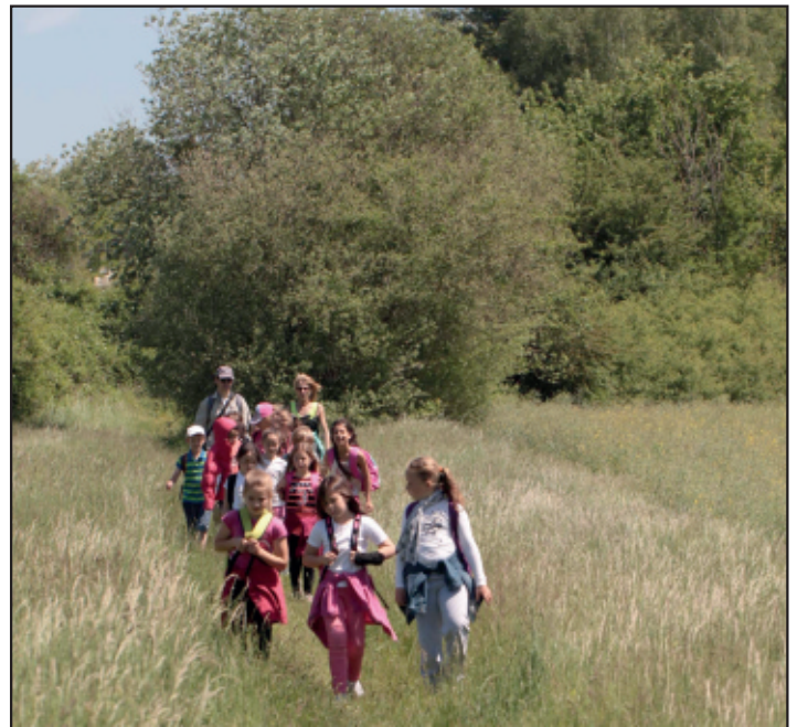
Sortie pour des élèves de CE 2 dans l'ENS du parc de Livry.

Association W772004031 Siège : Mairie de Livry-sur-Seine Tél: 07 70 06 23 31